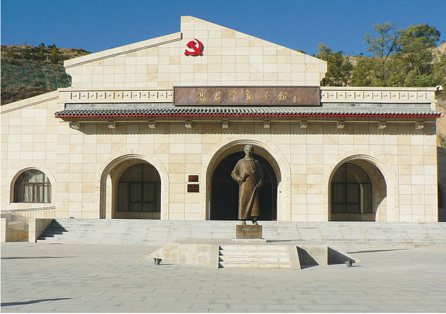
高君宇故居纪念馆

高君宇故居纪念馆位于娄烦县静游镇峰岭底村，占地面积约4.5万平方米，由高君宇故居、高君宇纪念馆和景观广场组成。高君宇是中国共产党早期的政治活动家、理论家，五四爱国运动的领导人之一，山西党团组织的创始人。在高君宇的指导和影响下，太原党小组、太原社会主义青年团、中共太原支部先后成立。党组织的成立是山西近代史上开天辟地的大事件，标志着在阎锡山统治的中心区域有了领导革命的核心力量，中国共产党的事业在山西有了组织者和推动者。作为山西第一个党组织，太原党组织点燃了三晋革命的星星之火，使太原成为全省党组织建立发展的发动机和策源地。在太原党组织的领导下，山西革命进入一个新阶段，开始了不屈不挠、艰苦卓绝的斗争历程。