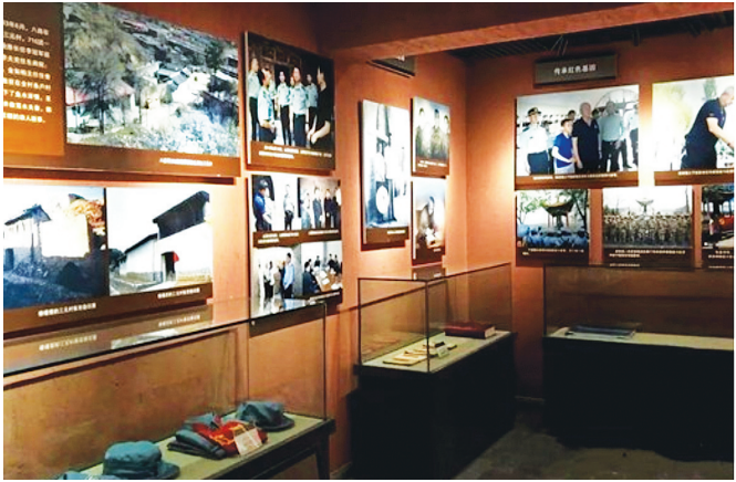
八路军358旅指挥部旧址暨张宗逊旧居

刘少奇路居旧址位于娄烦县米峪镇乡郭家庄村西北70米孙丑小院，占地面积580.16平方米，建筑面积72平方米。1942年12月，时任中共中央华中局书记兼新四军政委的刘少奇同志，由华中出发回延安途中，穿过敌人一道道封锁线，经山东、晋东南等地，长途跋涉来到太原至汾阳的公路上。八路军第358旅第7团政委杨秀山率部护送。当晚住于郭家庄村窑洞中，刘少奇同志看到桌子上放的一叠《抗战日报》，迅速走过去看起来，并向报纸是哪里出版的。当看到报纸上有印错的地方时，还掏出铅笔把印错的地方改过来。第二天天刚亮，杨秀山接到军区电报，请刘少奇赶快去中央分局。临行前，少奇同志指示他们：“好好工作，好好学习。你们这里很艰苦，要更多地关心群众的生活。”然后顺利地通过岚县、方山公路的敌人封锁线，前往兴县蔡家崖晋绥军区及晋绥中央分局所在地。路居旧址现为村民庭院，院落坐西朝东，一进院布局，中轴线存有正房，北侧存厢房。正房砖砌窑洞3孔，刘少奇住中间窑洞。1995年杨秀山将军为旧址题写“刘少奇同志路经之地”牌匾。