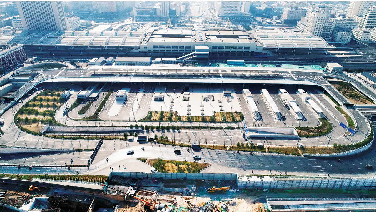
建成后的太原站东广场

迎泽大街东延的消息一出,就在广大市民当中引起了热烈反响,大家非常支持这项工程,认为工程不仅让迎泽大街更长,更给市民带来说不尽的好处。