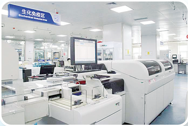
全自动生化分析仪