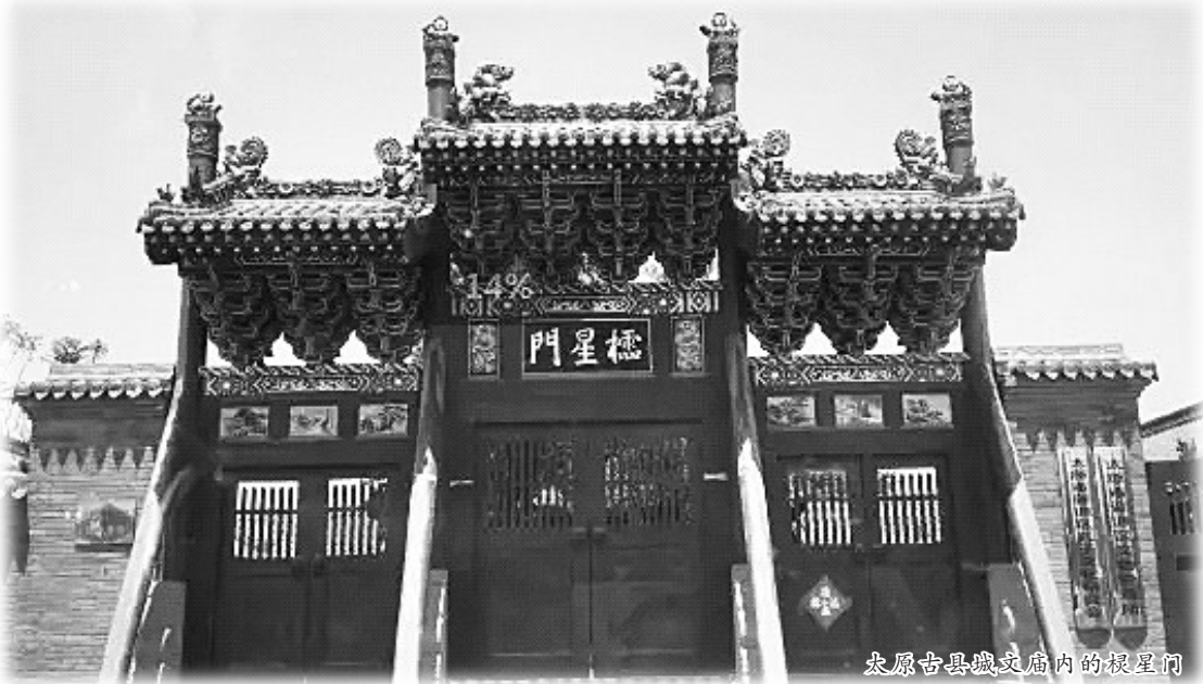
太原古县城文庙内的棖星门

太原古县城离家很近，又是晋源镇驻地，所以离开学校以后也经常进城去，有时也去文庙看看。上世纪70年代中期，太原二中迁走，大成殿以北，包括大操场、被晋源高中占用；大成殿以南的两个院子，曾被纸箱厂、木器厂等占用。我每次进文庙都要到处转着看看，大成殿前平台上古柏依旧，那个树窝仍然是原先的样子，而当年风华正茂的学子，如今已是白发老翁，不由得感叹光阴飞逝，人生易老。