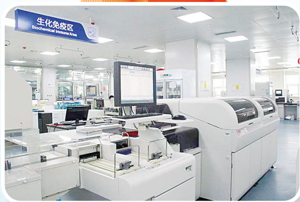
全自动生化分析仪