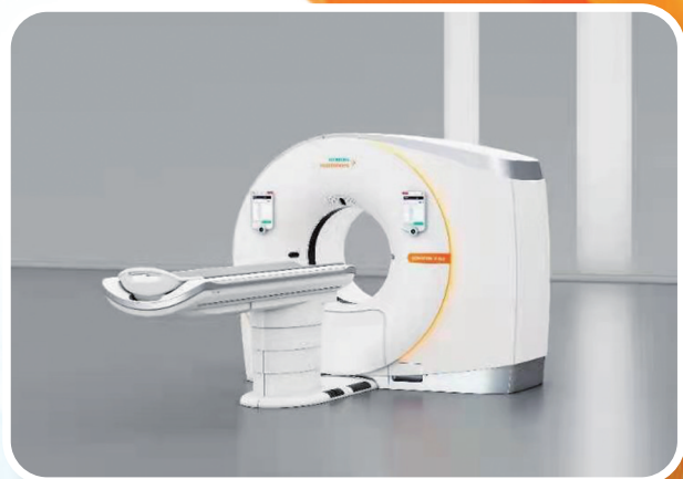
128 排 CT