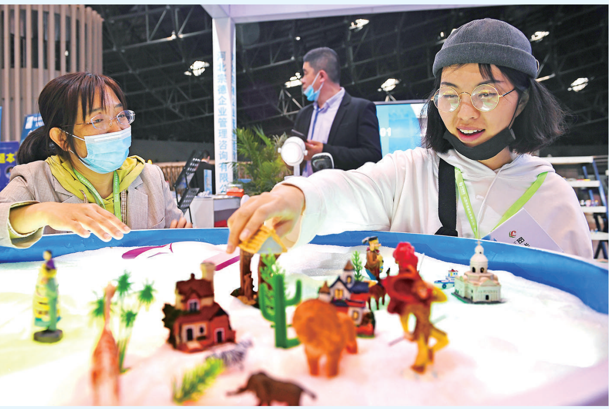
5月6日,2021山西教育装备展在煤炭交易中心开幕。本次展会为期3天,展品涵盖教学仪器设备、在线教育及远程教育、特殊教育、教育后勤装备5大门类,参展企业600余家。本次展会不仅为广大教育装备生产运营企业与教育管理部门、教育装备部门以及各级各类学校搭建了交流合作平台,也有力助推了我省教育装备向现代化迈进。图为观众体验用于治疗心理疾病的彩色沙盘。