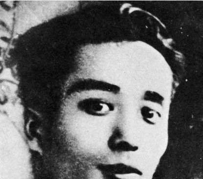
钱壮飞，原名钱壮秋，亦名钱潮，出生于浙江湖州一个丝商家庭。

在浙江省湖州市烈士陵园内东侧，有一座为纪念中共隐蔽战线“龙潭三杰”之一的钱壮飞烈士而建的纪念馆。今年是钱壮飞牺牲86周年。