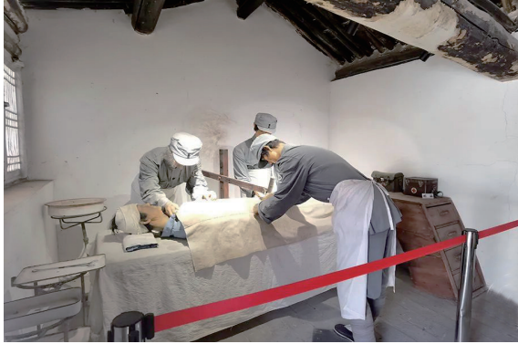
白求恩特种外科医院旧址

白求恩特种外科医院旧址位于灵丘县下关乡杨庄村的一座四合院内。这所医院是国际共产主义战士、加拿大著名外科医生白求恩根据抗日斗争的需要,在晋察冀军区医院一所驻地杨庄村创办的。医院旧址现存基本完好。 四合院内的3间正房为办公室,3间西房为诊疗室,3间东房为手术室。村东一座土木结构的二层小楼为白求恩大夫的休息室。小楼北侧3间瓦房为急救室,病房分散在村北的百余间民房里。 1939年1月5日,白求恩在医院举办实习周,为晋察冀军区一、三分区和359旅及各后方医院培训了23名外科医疗骨干,其中做外科手术700余例,使许多八路军伤病员得到及时救治,重返前线。 1976年灵丘县委、县政府在旧址建立了白求恩事迹展览馆,以原诊疗室作展览室。重新修复了白求恩住过的二层小楼和办公室,对原手术室进行了修缮,按原貌恢复了部分医疗卫生装备。 白求恩不远万里,来到中国,献身于国际反法西斯斗争。白求恩精神就是国际主义精神,就是毫不利己、专门利人的共产主义精神,表现为对工作极端负责、对同志对人民极端热忱、对技术精益求精。