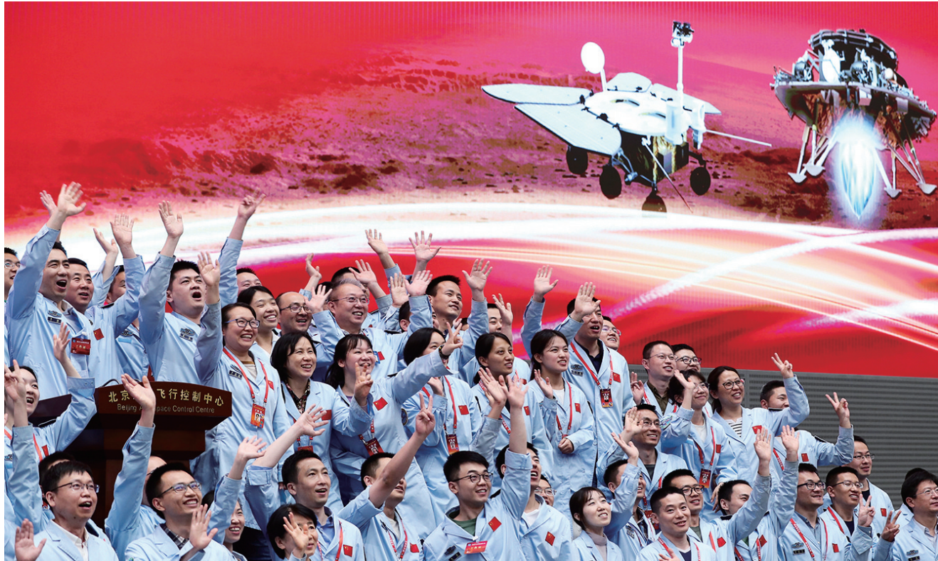
2021年5月15日,航天科研人员在北京航天飞行控制中心指挥大厅庆祝我国首次火星探测任务着陆火星成功。