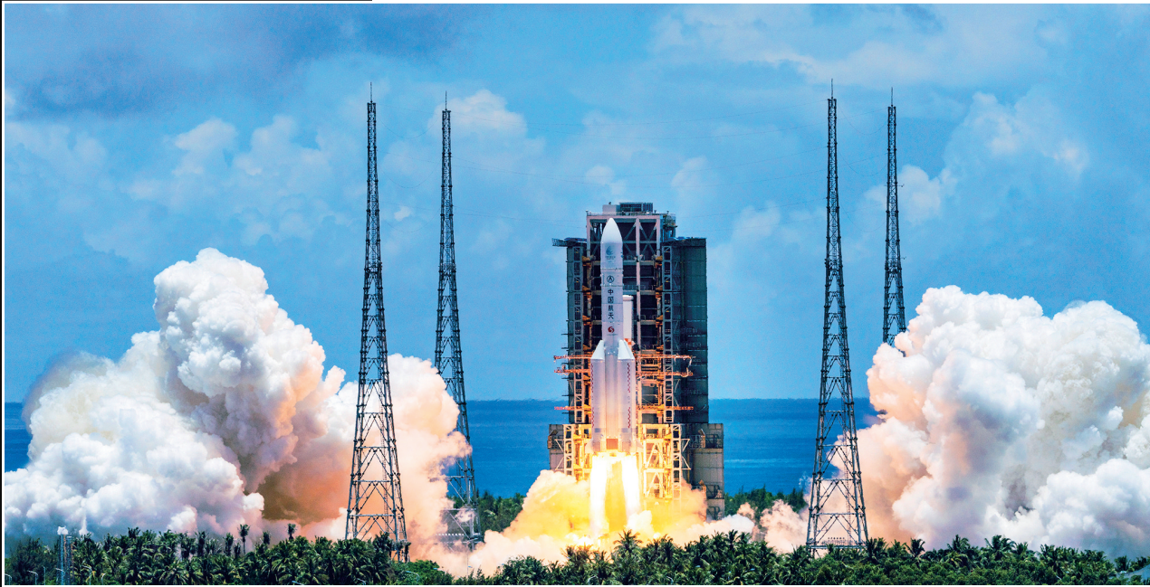
2020年7月23日,在海南文昌航天发射场,天问一号探测器由长征五号遥四运载火箭成功发射。