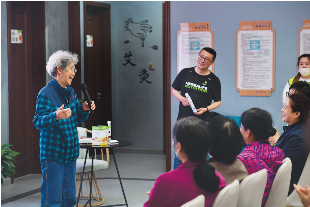
5月16日,在第七个“全民营养周”到来之际,滨河社区举办家庭健康知识分享会,居民代表现场分享了自家的健康生活方式。此次活动旨在帮助大家提升健康意识,了解膳食均衡的重要意义。

5月14日上午,杏花岭区迎春社区,志愿者走到居民楼下,抬头观察几户空巢老人家里的窗户。他们和老人有个“窗帘之约”,空巢独居老人早晨起床后拉开窗帘就表示家中无事,如果没有拉开,志愿者就会立即前往家中探望。 这是山西省红十字会情缘爱心志愿服务队和赛马场区域党群服务中心,联合开展的“窗帘行动”志愿服务项目,已经持续近一个月时间了。 90岁的居民谢大娘,不愿给儿女添负担,也不想离开住了几十年的老房子,老伴去世后,就一直独自生活,由儿女轮流过来照顾和送餐。谢大娘被社区纳入帮扶对象,和志愿者有了“窗帘之约”。每天早晨起床后,如不需要帮助,她都会准时把窗帘拉开。虽然看不到志愿者,谢大娘心里却有一份温暖和踏实,她知道有人在默默地关心她。 “窗帘行动”在4月启动后,有十多位空巢老人和谢大娘一样,被选为试点照顾对象。志愿者每天都会到