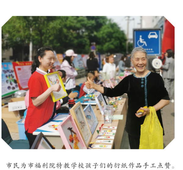
市民为市福利院特教学校孩子们的衍纸作品手工点赞。

本报讯 5月16日记者从市邮政管理局获悉,“邮快合作”是我市今年在推动快递进村中选用的一种模式,简单来说,就是快递企业进村的快件包裹,统一送到乡镇的邮政网点,再借助邮政网络优势,由邮政投递员送至村民手中。目前,我市在阳曲县的17个偏远村试点这种方式,让村民每天都能在家门口收到送进村的快递。 当前,快递企业末端服务网点已普遍覆盖到乡镇一级,农村村民可实现快递收寄,但需要在村、镇间来回奔波,也影响着农村电商的发展。为此,在市邮政管理局的推动下,阳曲县邮政公司与中通、圆通、申通、百世汇通、韵达5家民营快递企业顺利完成快件交接,标志着