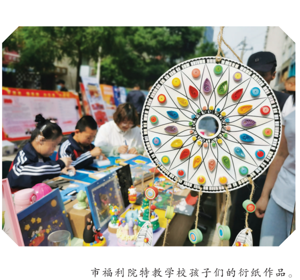
市福利院特教学校孩子们的衍纸作品。

我市“邮快合作”进村工程取得实效。 为推进“邮快合作”进村工程,今年在市邮政管理局的召集下,阳曲、娄烦、古交、清徐等县(市)的邮政公司与快递企业,共同对合作资费、投递范围、赔偿机制、人员车辆等细节问题协商,最终确定在阳曲县杨兴乡与西凌井乡2个乡镇的17个偏远的建制村率先合作。截至目前,每天通过“邮快合作”进村的快递有30多件,阳曲邮政公司的投递员均按正常频次投递。这样做,也节省了快递企业的派送成本。 市邮政管理局有关负责人介绍,将通过试点先行的方式,以点带面不断推进“邮快合作”进村的范围,助力我市“快递进村”最终实现全覆盖。(齐向真、马卓)