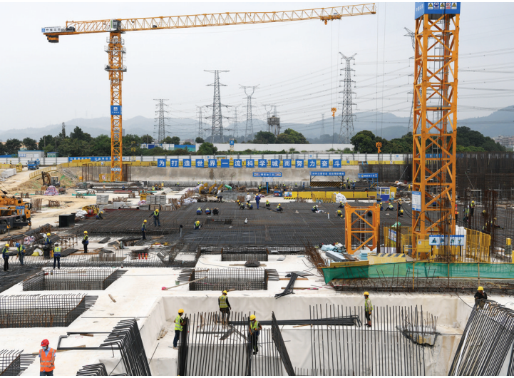
工人在深圳光明科学城启动区项目工地作业(2020年3月12日摄)。