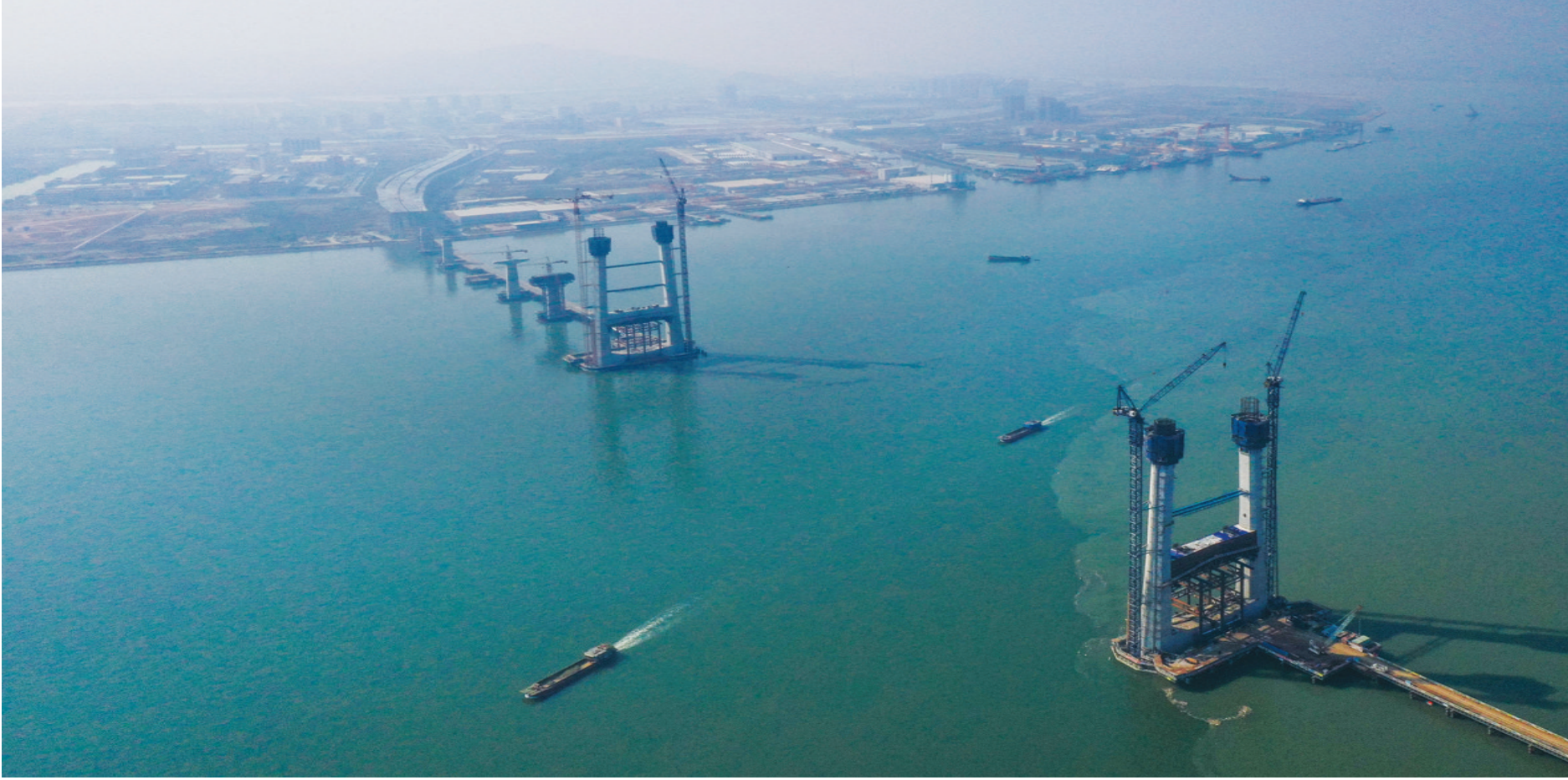
2021年2月2日,深中通道横门大桥两端的非通航孔桥将使用60米混凝土箱梁(无人机照片)。