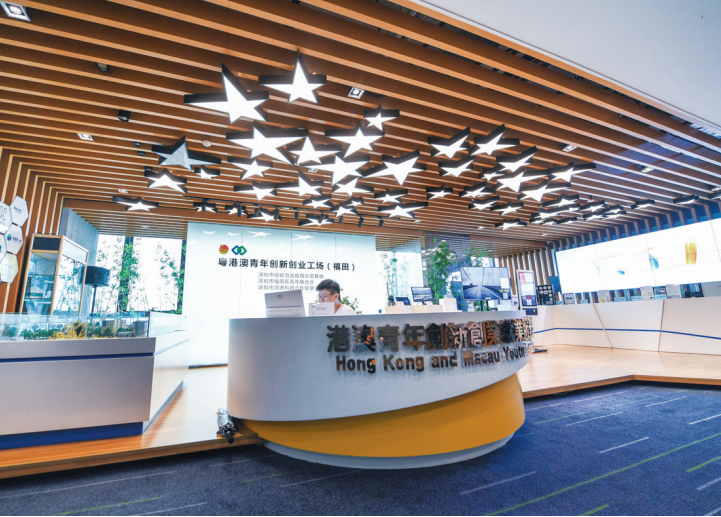
这是2020年8月12日在深圳市福田区深港科技创新合作区拍摄的粤港澳青年创新创业工场。