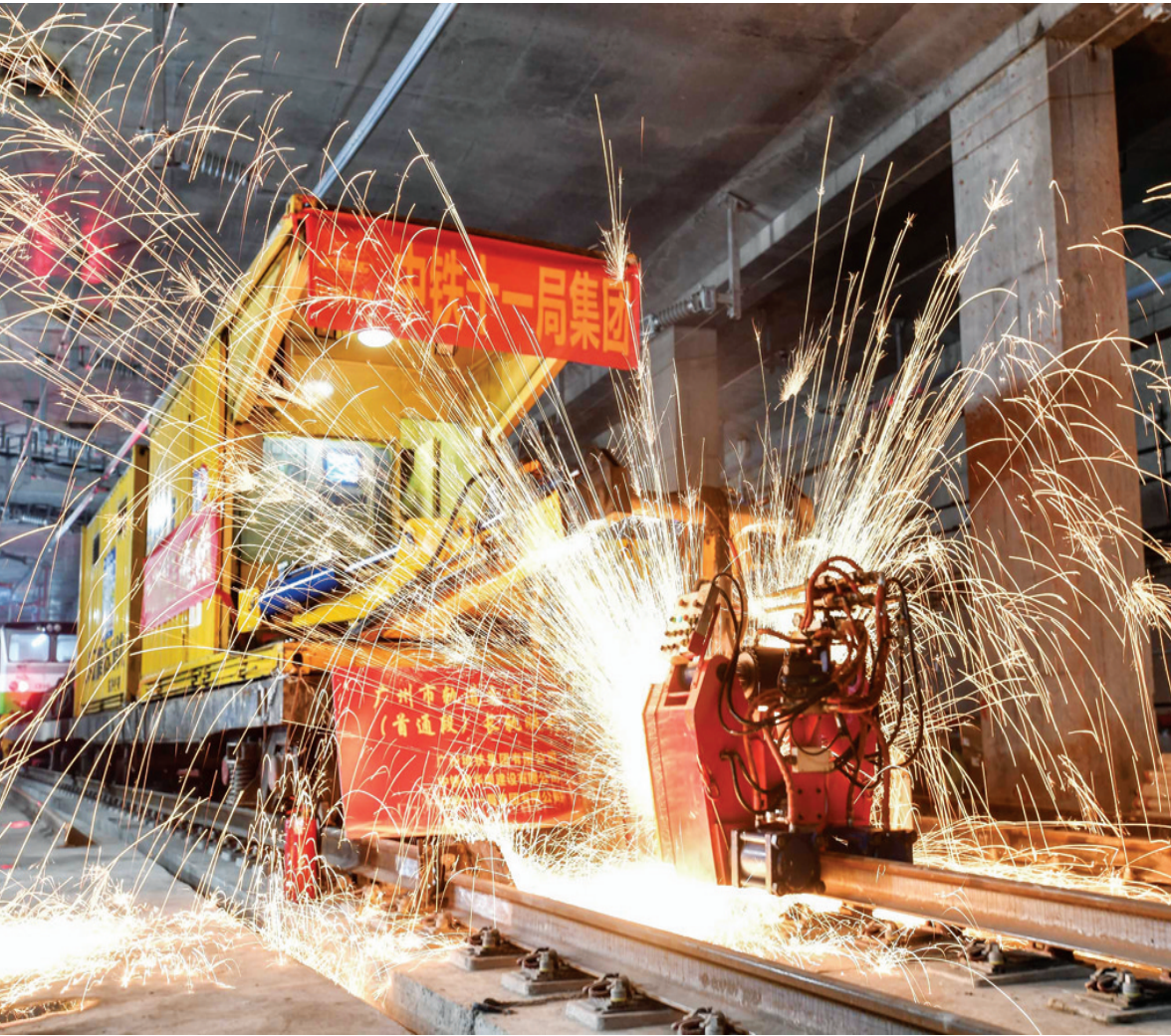
中铁十一局轨道焊机在焊接广州地铁18号线首通段最后一个钢轨接头(2021年4月20日摄)。