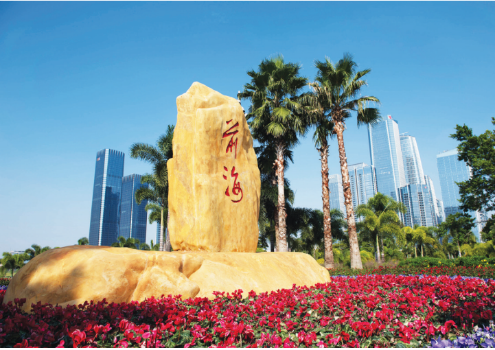
这是2020年10月12日拍摄的深圳前海石。