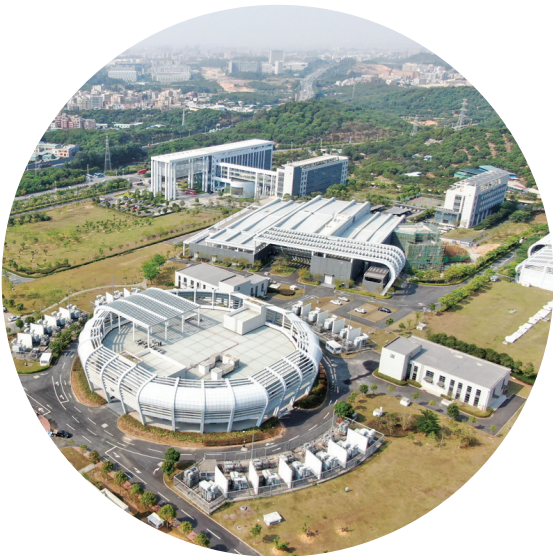
这是2021年4月21日在东莞松山湖拍摄的中国散裂中子源(无人机照片)。

放眼全球,湾区既是临海向洋的地理概念,也是备受瞩目的经济现象。在这里,有具有全球第一的港口吞吐量和世界级机场集群,港口年货物吞吐量超过16亿吨、机场旅客运送能力超过2亿人次,相当于3分钟就驶出一艘万吨巨轮,1分钟起降一架客机。在这里,有5.6万平方公里和8000多万人口,2020年创造经济总量超11万亿元,相当于以不到全国0.6%的面积,创造了全国12%的GDP,超过一个中等国家经济体,可入列全球十强。这里,正是中国第一湾——粤港澳大湾区。2017年7月1日,在习近平总书记亲自见证下,《深化粤港澳合作 推进大湾区建设框架协议》由国家发展改革委和粤港澳三地政府在香港签署,标志着粤港澳大湾区建设正式启动。习总书记作出重要指示,要求把这件大事办好。从协议规划,到蓝图铺展。近4年来,在以习近平同志为核心的党中央领航掌舵下,粤港澳大湾区建设迈出坚实步伐,成为推动“一国两制”事业发展的生动实践,向着国际一流湾区和世界级城市群的目标逐浪前行。潮涌大湾,千帆竞渡,这里有大机遇、大未来。