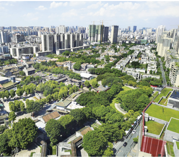
这是2020年拍摄的广东佛山岭南天地(资料图片)。