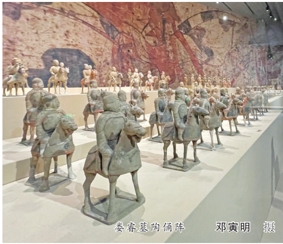
晋秦墓陶俑阵

年的记忆。展览的时间线追溯至远古时期,太原先民在“昭余祁穀”湖畔生存繁衍,土堂旧石器地点是目前太原地区发现的最早人类活动遗址,距今约50万年。