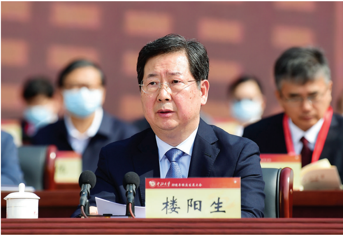
五月十九日,中北大学建校八十周年发展大会隆重举行,省委书记楼阳生出席大会并讲话。