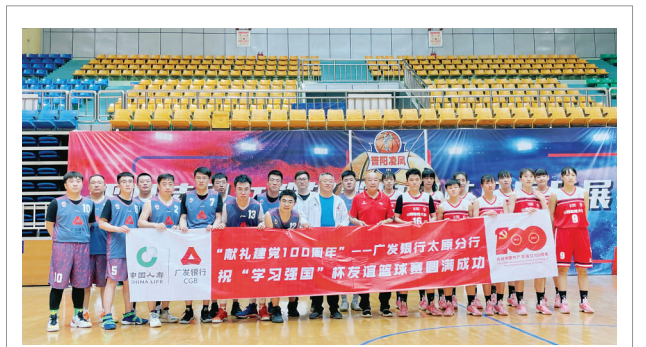
为庆祝建党100周年,进一步丰富员工文化生活,展现员工风采,近日,广发银行太原分行举办了篮球选拔赛,并组建篮球队参加同业举办的“学习强国”杯友谊篮球赛。