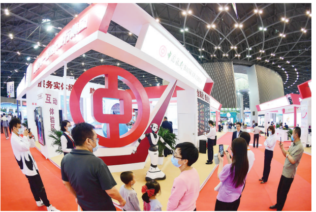
中国银行山西省分行展厅成市民拍照“打卡点”。

5月21日至23日,第十二届中国中部投资贸易博览会(简称“中部博览会”)在山西举办,中国银行山西省分行作为受邀参展银行,以“服务全球、融通世界,科技金融、绿色发展”为理念,在太原主会场搭建了81平方米的专题展