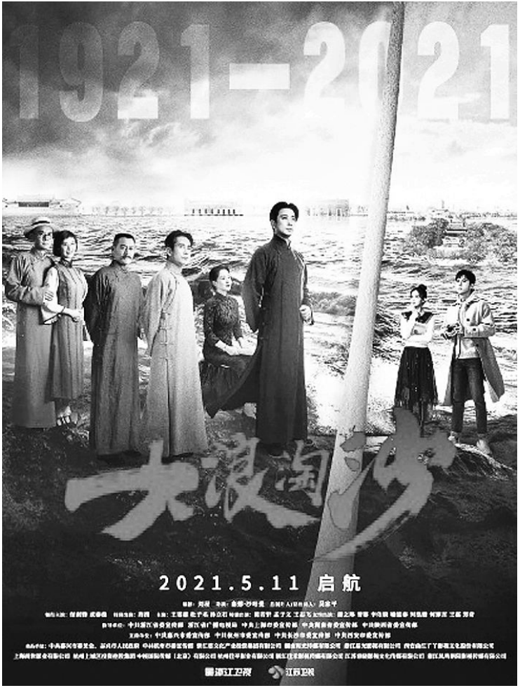
电视剧《大浪淘沙》海报

在主创看来,剧中的当代视角就是历史时空的延展生发——历史时空下,革命先辈们披荆斩棘为了什么?视频的制作者陈启航,以及正在观剧的万千年轻人都会明白,一切都是为了今天的美好生活。如此,历史的回响便在荧屏上具象化了。