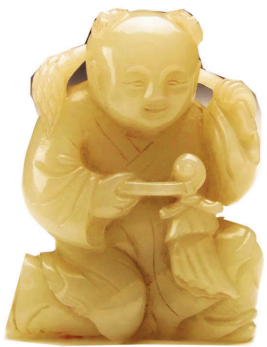
上图为清青玉五谷丰登娃娃 左图为清康熙五彩瓷娃娃