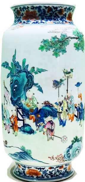
下图为清乾隆粉彩十六子灯笼瓶

清乾隆粉彩十六子灯笼瓶，因形似古代宫灯、表面绘画十六童子而得名；腹部主体图案以粉彩绘庭院，围栏内分布草坪、鲜花、秀石、芭蕉及梧桐树等景物，其间有十六个孩童游戏玩耍，各执玩具，表情各异，神态生动，栩栩如生，其天真、烂漫跃然器表。