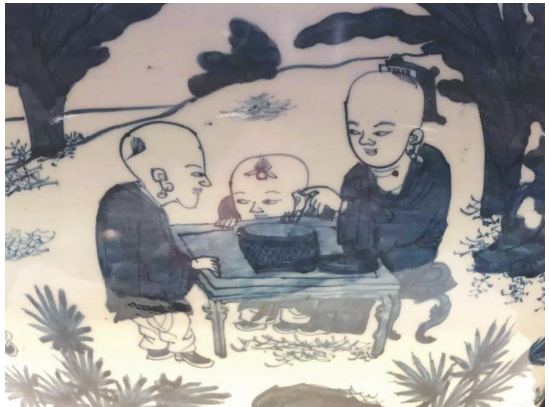
明代青花婴戏盖罐(局部)

金代磁州窑白地黑彩婴戏图枕，呈腰圆形，主题纹饰为一名头结发髻、身着团花长衫的儿童在户外嬉戏，拉着一个四轮鸭形玩具木车，右手置于腰间揽绳，左手于左肩处挽结，长出的绳子于胸前自然垂下。画面呈现出一派天真无邪的童趣。