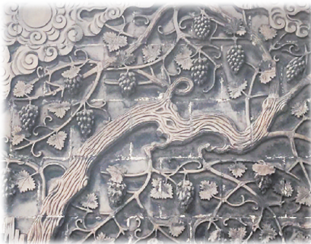
清徐宝梵寺葡萄砖雕(局部)

清徐宝梵寺山门对面是一座卷棚顶戏台，这座戏台最吸引人的是两侧影壁上的砖雕。以整枝葡萄为主线条，枝繁叶茂，硕果累累，看着就给人以喜获丰收之感。葡萄周围还配有日、月、山、水图案。清徐属于温带大陆性气候区，海拔高，昼夜温差大，四季分明，光照充足，降水时空分布良好，地下水资源丰富，适宜种植葡萄，有着栽培葡萄的悠久传统。元朝时，意大利人马可波罗曾经来到太原，在他的游记中写道：“太原一带有许多葡萄园，酿造许多酒，从太原贩运到全省各地销售。”清徐葡萄历来就是太原特产，2013年获得全国农产品地理标志。宝梵寺在砖雕上选择了最能代表清徐特色的葡萄。戏台上的砖雕当地人称为“一本万利(粒)图”，取葡萄多粒、多子而寓意多子多孙、富裕，表达了普通百姓期盼家族兴旺、绵延不断、福禄双全的美好愿望。传统文化中用水果来寓意吉祥的雕塑很普遍，但葡萄作为雕塑的主角却罕见。我曾在介休的后土庙中看到过葡萄的琉璃装饰，已经是琉璃中的珍稀之作。阳曲的归朝村，曾有一座葡萄照壁，被民俗学者称为“稀有”，其所在的院落亦被称为“葡萄院”。而宝梵寺的砖雕则直接将葡萄作为主题，占据了整座影壁的绝大部分，日月山川成为陪衬。这种突出清徐地方特色的做法，体现了当时清徐先民的构想和思维。清徐宝梵寺是比较完整的一座清代建筑，从建筑布局、建筑细部到神灵崇拜，都突出了清徐的地方特色。