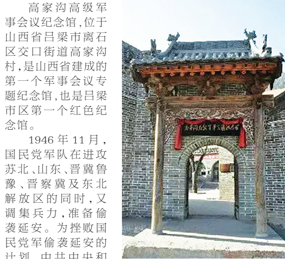
高家沟高级军事会议纪念馆

高家沟高级军事会议纪念馆，位于山西省吕梁市离石区交口街道高家沟村，是山西省建成的第一个军事会议专题纪念馆，也是吕梁市区第一个红色纪念馆。 1946年11月，国民党军队在进攻苏北、山东、晋冀鲁豫、晋察冀及东北解放区的同时，又调集兵力，准备偷袭延安。为挫败国民党军偷袭延安的计划，中共中央和中央军委审时度势，决定晋陕联防、三军配合、两翼牵制、保卫延安。 受中共中央军委和毛泽东主席委派，彭德怀、习仲勋于1946年12月16日，在高家沟村主持召开“陕甘宁边区、晋绥军区和晋冀鲁豫的大岳军区高级干部会议”，会议传达了中央关于陕甘宁与晋绥联防作战的精神，决定三军配合、两翼牵制、开辟吕梁战区，作出了统一领导黄河东西两个解放区的部署。会后发起的吕梁战役和汾孝战役，有力地迟滞了胡宗南集团突袭延安的计划，为保卫党中央、保卫陕甘宁边区作出了重大贡献，在中国共产党史上具有十分重要的意义。