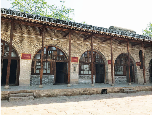
中共中央西北局旧址

中共中央西北局旧址位于临县林家坪镇南圪垛村，这里镌刻了革命伟人的不朽业绩：毛泽东、周恩来、刘少奇、彭德怀、贺龙、邓小平、叶剑英、习仲勋等老一辈无产阶级革命家曾在临县从事革命活动。2015年，中共临县县委、县政府对中共中央西北局旧址的2个院落和陕甘宁晋绥联防军旧址的4个院落进行保护、修缮、布展。目前，有习仲勋、马明方、马文瑞等领导人的旧居可供参观。 1947年8月，中共中央西北局和陕甘宁边区政府奉命东渡黄河，移驻临县，习仲勋为中共中央西北局书记和陕甘宁晋绥联防军政治委员，住在临县林家坪镇南圪垛村，即