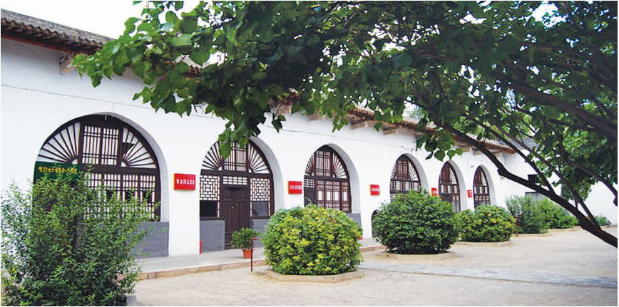
晋绥边区革命纪念馆

晋绥边区革命纪念馆位于兴县城西的蔡家崖村。抗日战争和解放战争时期，晋绥边区行政公署和晋绥军区就设在这里。1948年3月25日，毛泽东、周恩来、任弼时等中央领导同志东渡黄河来到蔡家崖，毛泽东发表了《在晋绥边区高级干部会议上的讲话》和《对晋绥日报编辑人员的谈话》，为晋绥人民指明了正确的前进方向，对全国革命形势的发展和边区的各项工作起了巨大的推动作用。 晋绥边区，又称晋绥解放区，由晋西北、晋西南、大青山地区（绥蒙区）三大块组成。是中国共产党领导的八路军、山西新军以及其他抗日部队，依靠广大人民群众的支持共同创建的，是我国最早的敌后主要根据地之一。晋绥边区位于山西省西部和绥远省（现属内蒙古自治区）中东部。它东至同蒲铁路，与晋察冀豫边区相接；西临黄河，与陕甘宁边区隔河相望；南达晋南三角地带风陵渡，北迄祖国北疆百灵庙、乌兰花一带，和蒙古人民共和国接壤。它地处黄土高原，南北纵长1000公里，东西横广250公里。 晋绥边区的战略地位极其重要。在抗日战争时期，它阻敌西进、屏障陕甘、拱卫延安，是保卫党中央的前卫阵地，是延安党中央与敌后各抗日