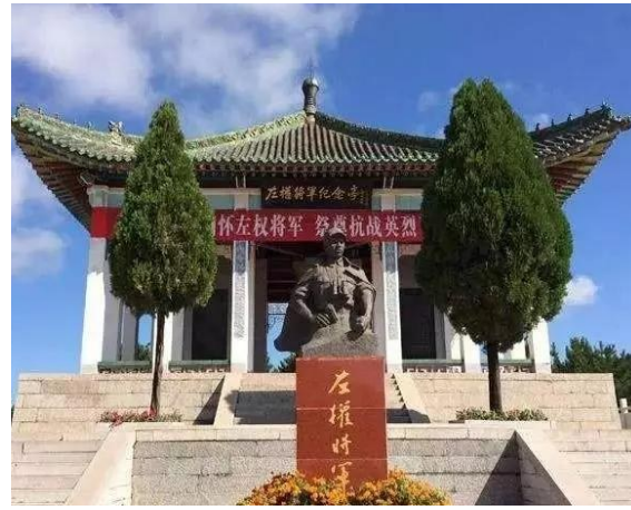
左权将军烈士陵园，位于左权县城内的北街胡同里，坐北向南。左权烈士陵园内有左权将军六角

纪念碑，左权将军的铜塑像、石膏像。园内一侧，还建有左权将军纪念馆一处。陵园内花草盛开，环境清幽，庄严肃穆。