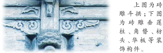
上图为砖雕斗拱;下图为砖雕垂莲柱、角替、枋头、华板等装饰构件。

日前,中央宣传部等9部门印发了《关于推进博物馆改革发展的指导意见》,明确指出:要加强博物馆队伍建设,推动特色发展,到2035年基本建成博物馆强国。 不论在历史上还是在当下,教育都是博物馆的重要职能。从1905年张謇创办的南通博物院算起,中国近现代公共博物馆发展历史已近120年。博物馆在展示方式上,从“馆舍天地”走向“大千世界”,逐步成为保护文化遗产、夯实文化建设的主体地;在传播形式上,从庙堂之高走进大众生活,逐渐成为传播中华文化、弘扬文化自信的大课堂。 在新时代,博物馆教育应当进一步融入大中小学课程体系。博物馆中的文化遗产能够阐释传统史学框架之外的、更为广阔的人文世界。石器时代的彩陶、玉器,展示了文字出现之前,中华大地文明起源的勃勃生机;古代墓葬中的石刻、壁画,展示了古代先民对家族、对生命的深刻思考;古代城市的轴线、建筑,展示了华夏民族对山川河流、礼仪秩序的珍视与创见;博物馆中陈列的文物本身还具有艺术性、多元性、生动性等诸多特质,可以有效提升历史教育的亲和力、感召力、创新力,使学生在馆舍参观、遗址行走、考古体验中,增强探索历史、触摸文化、传承文明的参与感和主动性。博物馆、文化遗产紧密结合人文教育,有机融入在校生课程,将助力在国民教育中培根铸魂、启智润心。 而且,博物馆应当更好发挥在革命文化、红色文化教育与传承中的作用。北大红楼的原状陈列、嘉兴红船的历史现场、长征沿线的文物遗存,这些都具有很高的历史价值。应该利用好革命博物馆的“红色基因库”资源,进而引导当代青年在理论和实践中全面了解国情,坚定理想信念。 还有一点不容忽视:博物馆教育应当在通俗性和严肃性中做好平衡。如今很多博物馆以新媒体技术拓展传播渠道,创新传播模式,凝聚青年群体,取得了丰硕成果。但也应该看到,个别地方的传播策划片面追求眼球效应,如以“盗墓”为噱头宣传考古遗址,以“野史”为噱头“重构”地方文化。甚至还有个别新建博物馆将较多违背常识的展品充入展示,这严重背离了博物馆教育的道德准则和学术准则,引致历史虚无主义之忧,需要社会大众和有关部門进一步加强引导、共同监督。