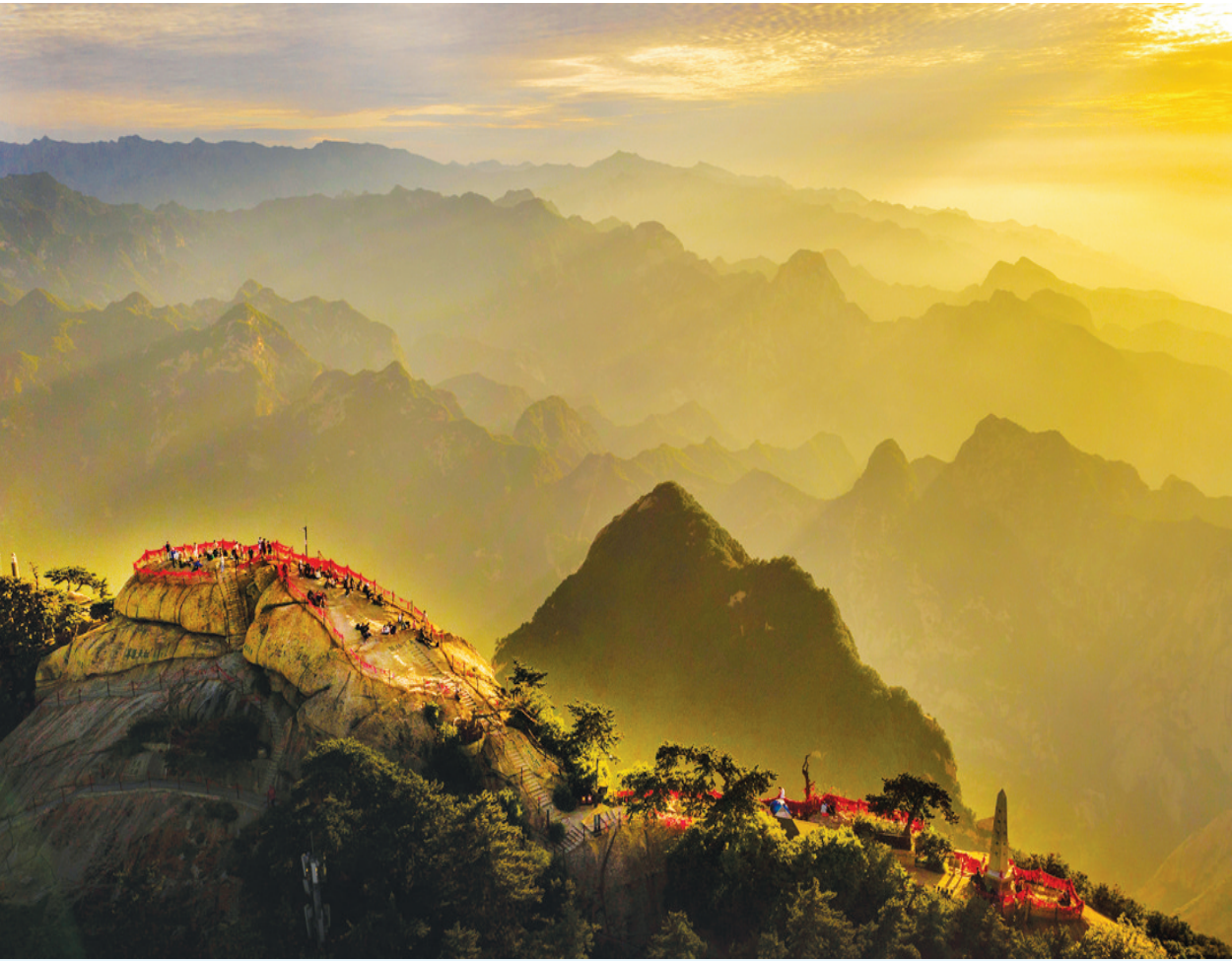
晚霞映华山 6月19日拍摄的晚霞映照下的华山西峰（无人机照片）。雨后初霁，位于陕西省华阴市的西岳华山在晚霞映照下，风光壮美。

据新华社上海6月18日电（记者 王辰阳、高亢）记者从中国汽车工业协会方面获悉，截至2021年5月底，我国新能源汽车保有量约580万辆，约占全球新能源汽车总量的50%。新能源汽车的快速发展，有利于碳达峰、碳中和的目标实现，促进经济社会全面绿色转型。 据了解，今年1月至5月，我国新能源汽车产销分别完成96.7万辆和95万辆，同比均增长2.2倍，市场渗透率达到了8.7%，增长势头强劲。与此同时，新能源汽车配套环境日趋完善，截至今年4月，全国已累计建设充电桩6.5万座、换电站644座，各类充电桩187万个，建成覆盖176个城市、超过5万公里的高速公路快充网络。 中国汽车工业协会常务副会长兼秘书长付炳峰18日在上海举行的2021中国汽车论坛上表示，尽管面对新冠肺炎疫情的冲击，我国汽车市场依然保持稳定，2020年的产销降幅在2%以内，汽车产量占全球比重达到32.5%，创历史新高。中国汽车市场的稳定，为全球车企提供了良好的经营支撑。 据预测，今后5年至8年，我国将有大量国Ⅳ标准及以下的在用车辆逐步面临淘汰替换，给新能源汽车市场带来较大的发展空间。未来5年电动汽车产销增速预计将保持在40%以上。