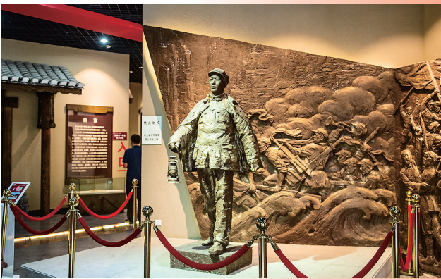
这是在苟坝会议陈列馆拍摄的毛泽东身披外套、提着马灯疾行的雕塑(2019年7月5日摄)。