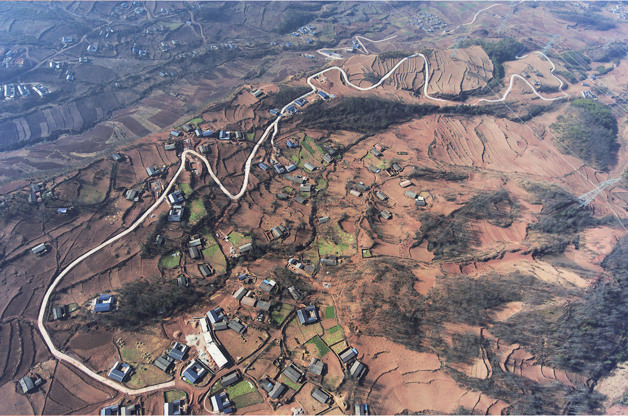
这是四川省凉山彝族自治州美姑县四峨吉村约6公里的道路硬化项目(2017年2月12日摄，无人机照片)。

东方，这是“将毕也钜”的生动诠释。 中国共产党人把“担当”写进党章——中国共产党是中国工人阶级的先锋队，同时是中国人民和中华民族的先锋队，是中国特色社会主义事业的领导核心。 看似寻常最奇崛，成如容易却艰辛。回望百年，中国共产党为何能由小变大、由大向强？ 一个政党、一个国家，领导核心至关重要。 1935年3月10日夜，贵州遵义枫香镇苟坝村前一条崎岖狭窄的小道上，毛泽东手提一盏马灯，步履匆匆去找周恩来商讨战事。 马灯微茫，照亮革命前路。毛泽东的力排众议，与工农红军和未来中国的命运紧紧相连。他正确判断战情，红军得以避免再次陷入重围、再次遭受重创。 遵义会议在危急关头挽救了党，党的十一届三中全会作出改革开放的伟大抉择，党的十八大擘画新时代中国特色社会主义思想宏伟蓝图…… 新中国的缔造者、改革开放总设计师、新时代的领航人，在生死存亡关头、重大抉择时刻、复兴关键阶段，引领全党不断迈向新的胜利。 实事求是，独立自主，坚持真理、修正谬误。把马克思主义基本原理同中国革命和建设具体实际相结合，走自己的道路。 从重新确立解放思想、实事求是思想路线，到把“社会主义”和“市场经济”结合起来，再到“五位一体”总体布局、“四个全面”战略布局……党带领人民创下经济快速发展和社会长期稳定“两大奇迹”，刷新世界对中国的认知。 经济总量不断攀升到稳居世界第二；八年时间实现9899万农村贫困人口全部脱贫；平均寿命从新中国成立前的35岁增长到77岁……从一穷二白起步，拥有5000多年文明史的中华民族正在迈向新的高度。 毛泽东思想、邓小平理论、“三个代表”重要思想、科学发展观、习近平新时代中国特色社会主义思想……中国共产党人不断开辟马克思主义、中国特色社会主义新境界。 道远且长，虽远必达；心之所向，行必能至。