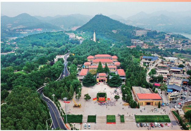
河北省平山县西柏坡纪念馆外景(6月13日摄，无人机照片)。

我们经常说红木家具，但是许多朋友对红木种类还不是很了解，2017版红木国家标准于2018年7月1日开始实施，新国标在2000年版基础上略作微调，对红木进行了界定和分类：共有五属八类二十九种，大多产自东南亚、热带非洲和拉丁美洲。从这期开始细细的和您分享。 新国标红木的制订，要考虑到的要素不仅拘泥于销售市场和经济发展视角，而且从地理环境、里程碑式、工艺性能、客观性使用价值、实用价值等方面开展综合性考虑。因而，假如你了解了这一规范，能精确地记牢每种属、每类型的红木，那么在挑选红木家具的时候就能游刃有余了。 红五属即紫檀属、黄檀属、崖豆属、决明属、柿属。我们可以把这五属冠以姓氏来理解，紫檀属为紫姓家族，黄檀属为黄姓家族，崖豆属为崖姓家族，决明属为决姓家族，柿属为柿姓家族。 八类则是以木材的商品名来命名，即