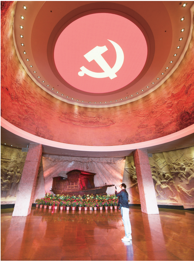
游客参观南湖革命纪念馆(2020年10月28日摄)。

于变局中开新局。在习近平总书记深邃思考、统筹谋划下，一幅面向2035年的社会主义现代化国家新图景铺展在世界面前—— 经济实力、科技实力、综合国力将大幅跃升；基本实现新型工业化、信息化、城镇化、农业现代化，建成现代化经济体系；人的全面发展、全体人民共同富裕取得更为明显的实质性进展…… 今年一季度，中国经济同比增长18.3%。可圈可点的成绩单，关键时点的精准研判，展现党中央对复杂形势的科学把握，让世界看到一个个百年大党一张蓝图绘到底、坚定不移向前进的决心和行动。 从南湖红船扬帆启航，到走出西柏坡“进京赶考”，再到建设中国特色社会主义巍峨大厦……不懈奋斗和艰辛探索早已证明：“我们不但善于破坏一个旧世界，我们还将善于建设一个新世界”。 “我深信中国共产党的成功基于两个因素：一是它有一套稳定价值观念能长期秉持，另一个是非常好的自我革新能力。”匈牙利前总理迈杰希·彼得说。 百年风雨，一个政党何以始终保持革命精神，永葆先进性、纯洁性，以党的自我革命引领伟大社会革命？ 1927年，中共五大选举产生首届中央监察委员会。强化党内监督、严明政治纪律，从此被摆在突出位置。 1952年，刘青山、张子善被判处死刑，共和国反腐第一案轰动全国。 9100多万党员，“大就要有大的样子”。出台八项规定、推动巡视全覆盖、深化监察体制改革……党的十八大以来，刮骨疗毒，强身健体，让百年大党焕发出更加蓬勃旺盛的生机活力。 百年来路沧桑，初心从未改变。中国共产党带领中华民族站起来、富起来、强起来，掌舵中国号巨轮行稳致远。 百年恰是芳华，立志千秋伟业。中国共产党永不懈怠，为实现中华民族伟大复兴的中国梦接续奋斗。 在以习近平同志为核心的党中央坚强领导下，中国人民信心满满，必将创造新的更大辉煌，不断从胜利走向新的胜利！ 新华社记者 杨维汉 罗沙 丁小溪 熊丰 (新华社北京6月21日电)