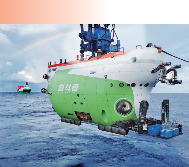
这是“奋斗者”号(资料照片)。

2021年仲夏，北京奥林匹克公园龙形水系旁，新近落成的中国共产党历史展览馆巍然矗立。 “……对党忠诚，积极工作，为共产主义奋斗终身……”在庆祝中国共产党成立100周年之际，习近平总书记来到这里参观，并带领党员领导同志重温入党誓词。 “我们党的一百年，是矢志践行初心使命的一百年，是筚路蓝缕奠基立业的一百年，是创造辉煌开辟未来的一百年。”短短一段话，道尽百年苦难辉煌—— 五千年中华文明横遭帝国主义列强肆虐，山河破碎、民不聊生。无数仁人志士、政党组织反复求索，却迟迟难以找到救亡图存的正道。改良主义、自由主义、三民主义……却“诸路皆走不通了”。 直到一粒源于德国小镇特里尔的种子，在东方文明古国破土而出……中国共产党如旭日初升，照亮民族复兴前程，彻底改变中国前途命运。 从最初50多人，到拥有超过9100万党员；从国家生灵涂炭、一穷二白，到成为世界第二大经济体，脱贫攻坚全面胜利，实现人民千年梦想、百年夙愿；从铁钉、火柴都要进口，到“天问一号”着陆火星、“奋斗者”号万米深潜…… “作始也简，将毕也钜。”一个大党启航于一叶扁舟，这是“作始也简”的最好注解。一个国家必将巍然屹立于世界