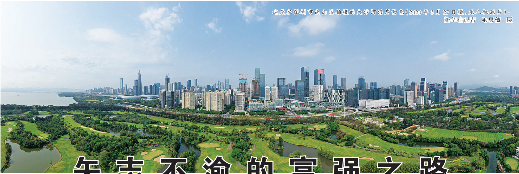
这是在深圳市南山区拍摄的大沙河沿岸景色（2020年3月27日报，无人机照片）。