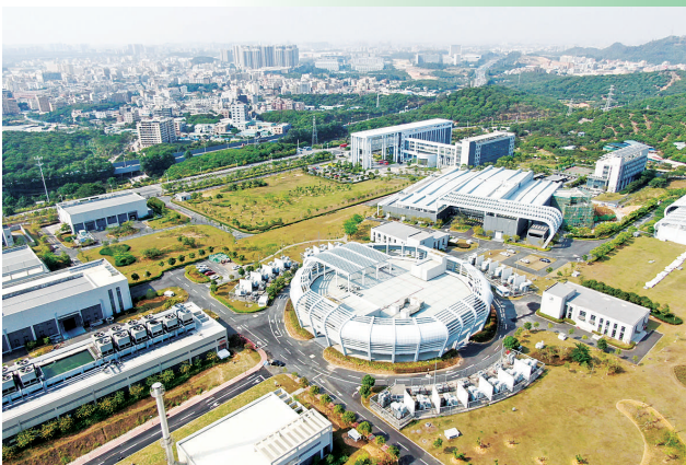
这是位于广东东莞松山湖的中国散裂中子源（4月21日报，无人机照片）。依托中国散裂中子源，东莞松山湖科学城全面启动，昔日制造业基地成为大湾区科创新坐标。

抓好的工作。”习近平总书记说。 发展的理念既一以贯之，又不断创新、与时俱进；面向未来，新发展理念正有力指引各地发展实践，走上高质量发展的宽阔大道。 南部粤港澳大湾区，依托中国散裂中子源，东莞松山湖科学城全面启动，昔日制造业基地成为大湾区科创新坐标； 中部长江经济带，沿江11省市大力推进生态环境整治，“共抓大保护、不搞大开发”，共同舞动高质量发展的“绿色长龙”； 北部雄安新区，工地上热火朝天，一批基础性重大工程稳扎稳打推进，“保持历史耐心和战略定力”誓将一张蓝图干到底…… 知道向何处去，更能读懂未来的中国。 着眼高质量发展，以新发展格局重塑竞争力—— 海南，自由贸易港建设一派繁忙。不久前，汇聚全球精品的首届中国国际消费品博览会在此落幕。 广交会、服贸会、进博会、消博会……一个个共享机遇的合作平台，成为中国畅通国内国际“双循环”的生动实践，勾勒出加快构建新发展格局的壮阔图景。 着眼高质量发展，以深化改革开放激发新动能—— 广东深圳，朝着建设中国特色社会主义先行示范区加快推进；上海浦东，打造社会主义现代化建设引领区迈出新步伐；浙江全省，以高质量发展为促进全体人民共同富裕探索路径…… 今年以来，系列深化改革开放举措密集出台，经济活力不断显现：前5个月，全国高技术产业投资两年平均增长13.2%，快于全部投资增长；新设外商投资企业18497家，同比增长48.6%，较2019年同期增长12.4%…… 着眼高质量发展，要始终坚持以人民为中心—— 脱贫攻坚，1800多名党员牺牲在扶贫第一线；抗击疫情，4.2万余名医护人员逆行出征，牺牲医护人员中党员占70%以上……为人民而生，因人民而兴，始终同人民在一起，为人民利益而奋斗，是我们党立党兴党强党的根本出发点和落脚点。 “中共之所以能成功带领中国取得辉煌成就，核心秘诀是始终保持和广大人民的紧密联系，时刻不忘为人民服务的初心，得到了人民的高度信任和广泛支持。”英国共产党总书记格里菲思说。 新征程的号角已经吹响，在中国共产党的坚强领导下，亿万人民团结奋进，中华民族伟大复兴的磅礴力量势不可挡！ 新华社记者（新华社北京6月23日电）