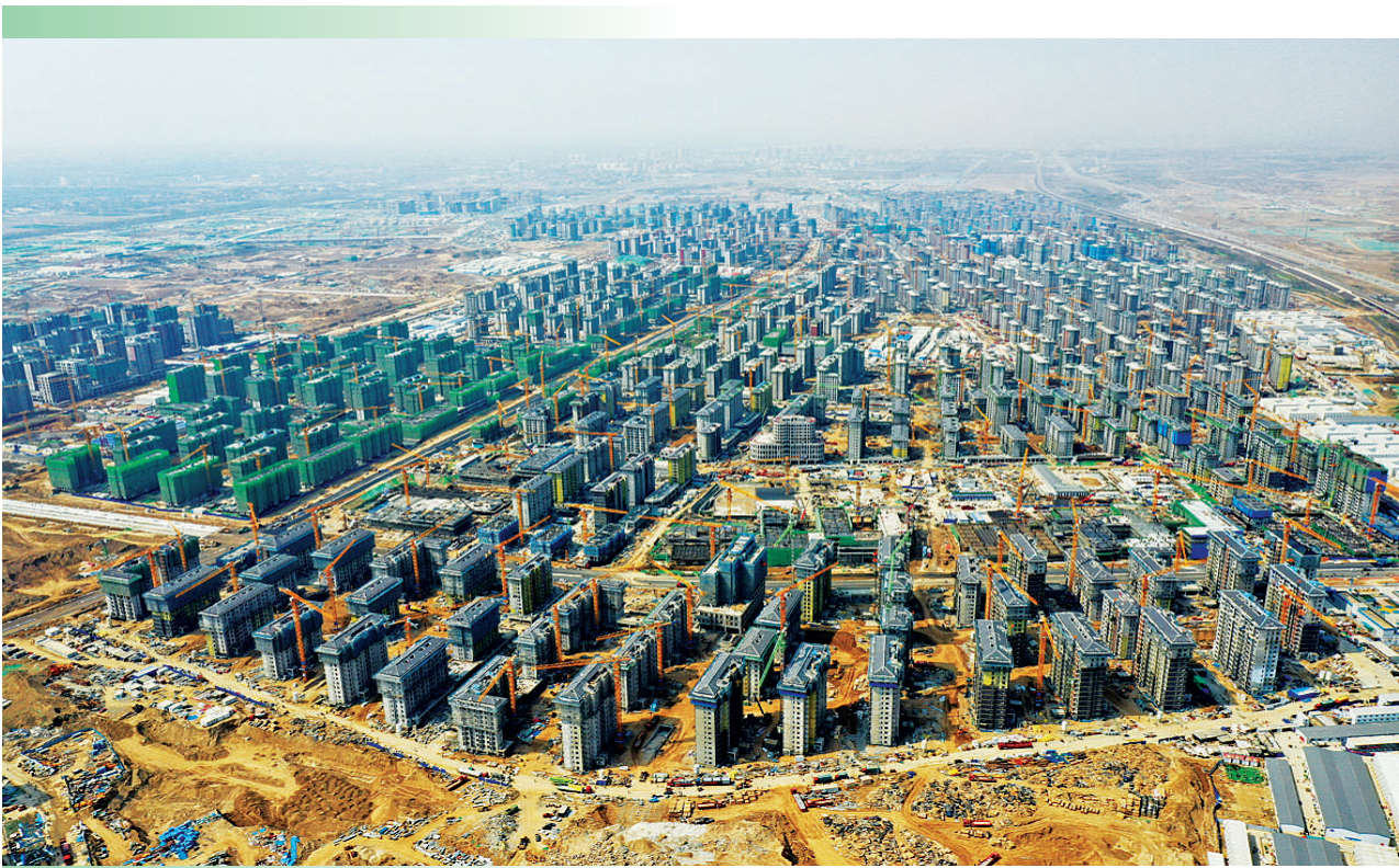
4月8日拍摄的河北雄安新区容东片区安置房项目建设现场（无人机照片）。

江西于都，红军长征集结出发地。 初夏时分的梓山镇潭头村，现代化标准蔬菜大棚鳞次栉比，白墙黛瓦、绿树成荫，清池塘、景观亭点缀其间…… 昔日贫困村，脱贫后接力乡村振兴，种下富硒菜，吃上旅游饭，如今展现新颜。 “去年家里收入22万元，在过去想都不敢想。”红军烈士后代孙观发的话里，透着发自内心的幸福。 民族要复兴，乡村必振兴。脱贫摘帽不是终点，而是新生活新奋斗的起点。 走过百年路，再启新征程。 站在新的历史起点上，世界百年未有之大变局加速演进，疫情仍在全球不少国家蔓延，国内发展不平衡不充分问题依然突出……越是接近目标，路越陡、浪更急。 “立足新发展阶段、贯彻新发展理念、构建新发展格局，推动高质量发展，是当前和今后一个时期全党全国必须抓紧