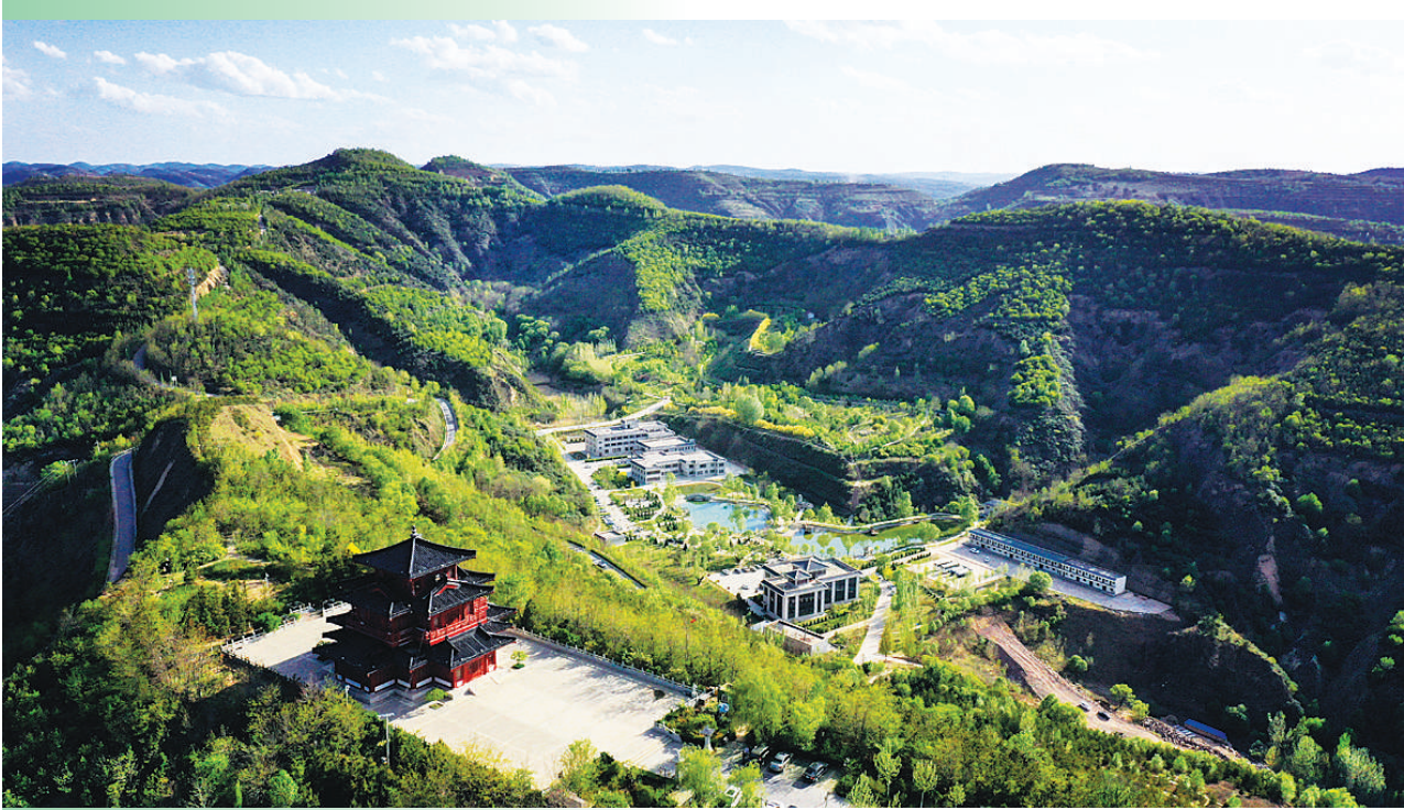
位于陕西延安市吴起县的退耕还林森林公园（2019年5月11日报，无人机照片）。