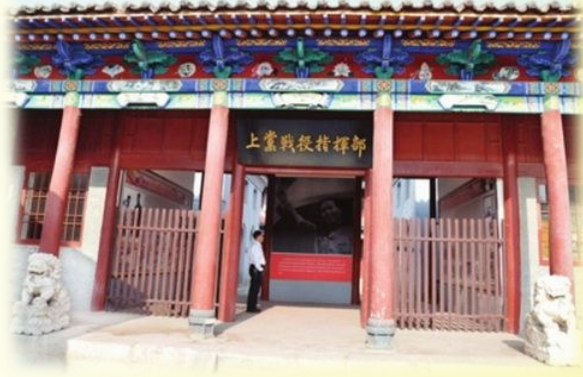
上党战役指挥部旧址

冀南银行旧址位于黎城县黄崖洞镇小寨村，现存有冀南银行总行旧址、总行政治部旧址、印钞厂旧址等，总占地面积2.5万平方米。旧址内设有冀南银行发展历史的基本陈列。它是全国唯一保存完好的根据地银行旧址，具有较高的历史价值和旅游价值。