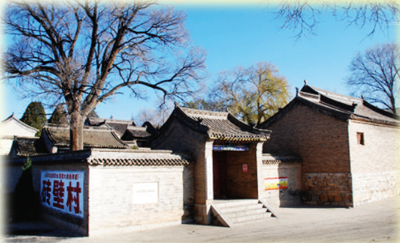
砖壁八路军总部旧址

1941年11月11日，7000余名日寇进犯黄崖洞。我军特务团奉命保卫黄崖洞兵工厂。团长欧致富在彭德怀副总司令和左权副参谋长的直接指挥下，带领战士与4倍于我军的敌人激战8昼夜，到11月19日战斗结束，毙伤敌人2000多人，保卫了兵工厂，取得了敌我伤亡6比1的辉煌战果。黄崖洞保卫战被中央军委评价为“1941年以来反扫荡最成功的一次模范战斗”，八路军总部授予特务团“黄崖洞保卫战英雄团”的光荣称号。黄崖洞保卫战打出了八路军威风，打击了日本侵略军的嚣张气焰。