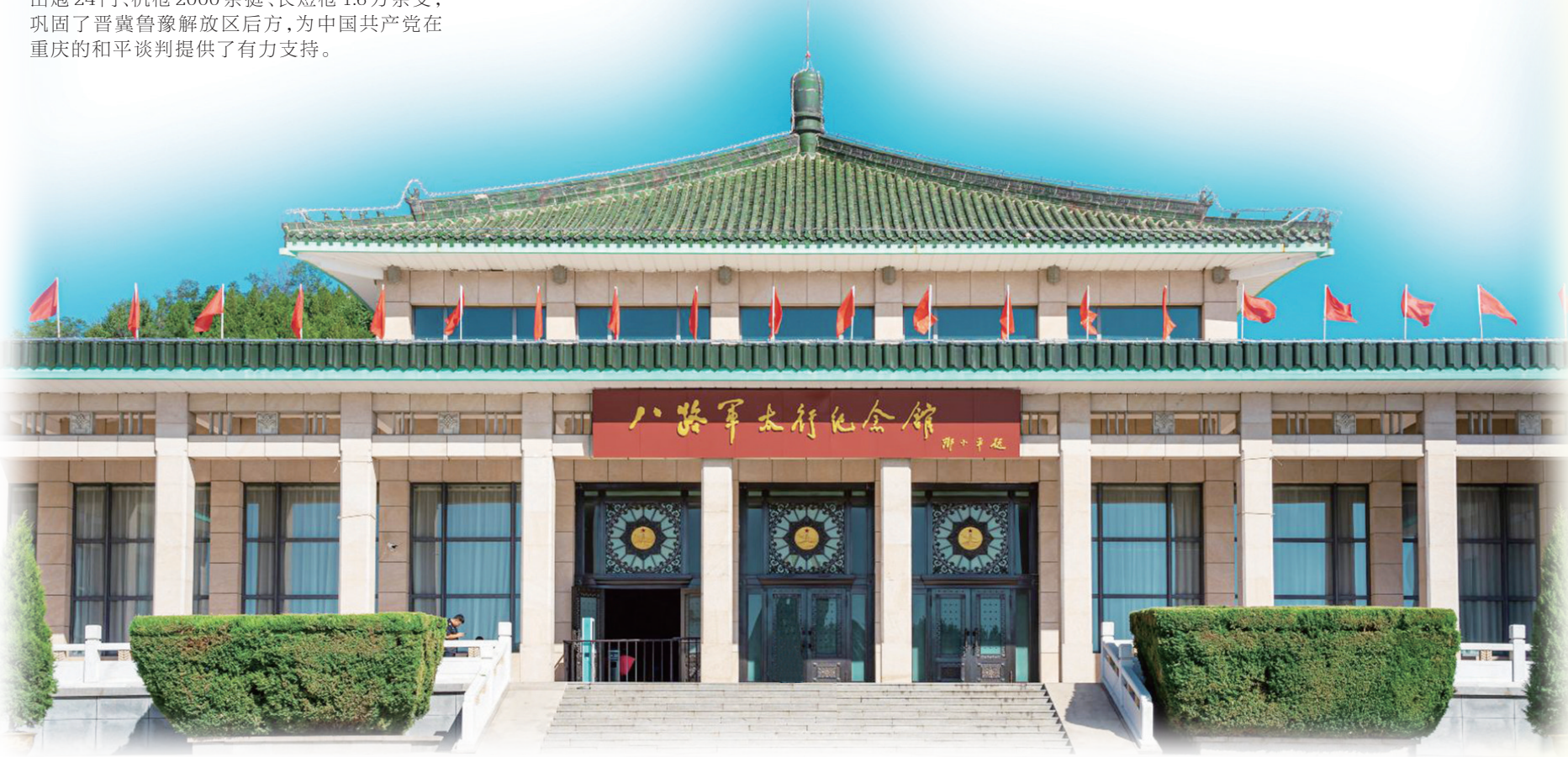
八路军太行纪念馆

沁源围困战历时两年半，共作战2800余次，毙日伪军3078人，俘获日特汉奸245人，解救被捕群众1700余人，夺回牲畜2000多头(只)，最终将敌人赶出沁源，粉碎了日本侵略者摧毁太岳根据地的阴谋。