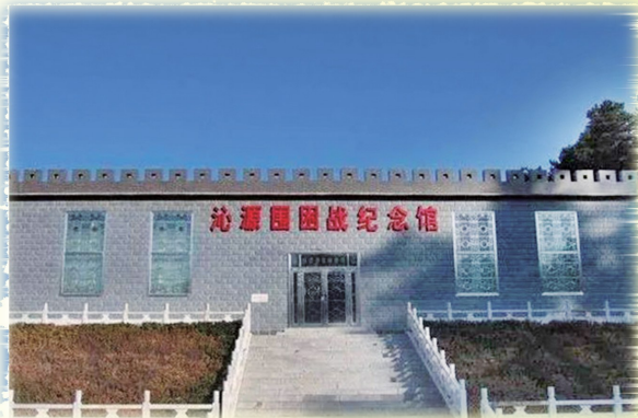
沁源围困战纪念馆