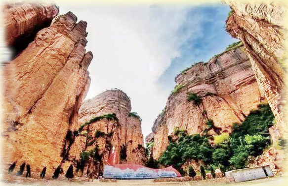
黄崖洞兵工厂旧址