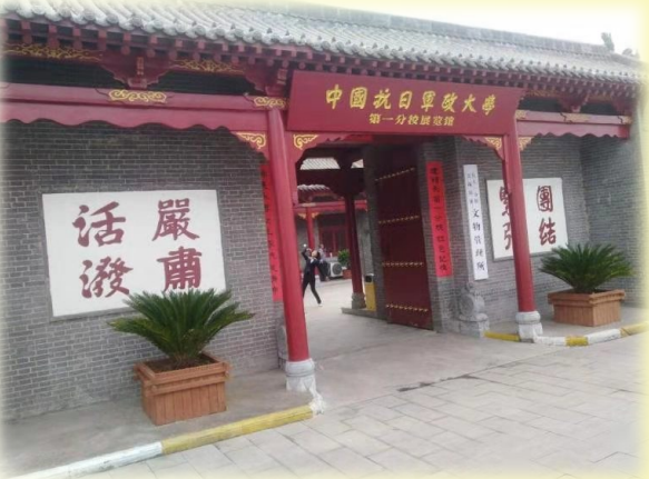
抗大一分校(岗上村)旧址