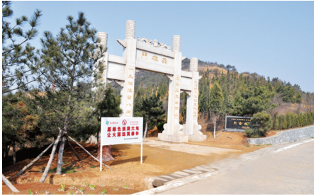
中国人民解放军长江支队纪念林

中国人民解放军长江支队纪念林位于晋城市白马寺山森林公园内，占地面积150亩，林内修建有长江支队主题雕塑、英雄门、思乡亭等景点。 1949年初，为响应党中央、毛泽东主席“打过长江去，解放全中国”的号召，800多名晋城儿女与革命老区地方干部组成长江支队南下福建，在接管政权、土地改革、民主建政和社会主义建设中谱写了一曲荡气回肠的英雄赞歌。