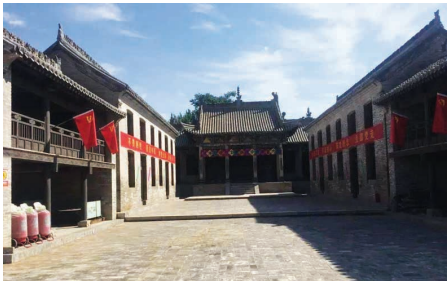
晋冀鲁豫野战军 十二纵队整军地旧址

晋冀鲁豫野战军十二纵队整军地旧址位于晋城市城区北石店镇南石店村。 1946年10月，中原解放军粉碎国民党几十万大军的围堵后，主动进行战略转移，军区领导机关及一部分部队在李先念司令员、郑位三政委的率领下驻扎晋城，司令部设在南石店村。1947年7月下旬，经过十个月左右的休整，这支部队被改编为晋冀鲁豫野战军第十二纵队。8月初，李先念亲率十二纵队从晋城出发，随刘邓大军强渡黄河、挺进中原，开始了反攻中原的胜利进军。