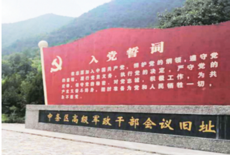
中条区高级军政干部会议旧址

中条区高级军政干部会议旧址位于阳城县董封乡上河村，建筑面积432平方米。 1942年5月，中共晋豫区党委、太岳南进支队重新开辟晋豫边抗日根据地取得初步成效，在晋豫边中条山地区建立了阳城、垣曲、绛县、沁水、晋城、翼城6个县的抗日民主政府，基本扫清了活动区域内顽伪和土匪武装，创造了开展敌后游击战争的有利条件。 5月下旬，晋豫区领导机关转战至阳城县上河村。27日，中共晋豫区党委利用战争间隙在上河村召开了中条区高级军政干部会议，研究进一步开辟晋豫边抗日根据地的大政方针。28日午后，日伪向上河村袭来，会议被迫结束，与会人员分散转移，警卫部队掩护邓小平和晋豫区首长向沁水东、西川方向转移。