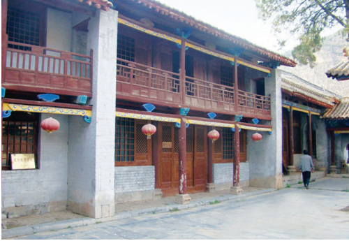
中国人民抗日军政大学 太岳分校旧址

中国人民抗日军政大学太岳分校旧址位于沁水县土沃乡南阳村。 1943年春，中国人民抗日军政大学太岳分校奉上级命令，从岳北转移到沁水南部的下川地区，为缩小目标、迷惑敌人，改名为“太岳军区历山大队”。5月，太岳军区粉碎了日军“铁滚扫荡”之后，历山大队从下川地区转移到沁南县政府所在地——南阳，大队部设在南阳村玉皇庙的后院东厢房，政治部设在后院西厢房。正北大宝殿现在是抗大俱乐部的展览馆，院中心宽敞明亮的阁楼大厅，摆着整齐的木凳和石桌，阁楼大厅正前方挂着鲜红长幅，上书校训——“团结、紧张、严肃、活泼”。 太岳抗大分校在南阳办学近三年，培养了政治素质高、军事技术硬、工作作风好的军政干部近千人，积累了战争岁月一边学习、一边战斗、一边生产的办学经验，铸就了抗战史上一座丰碑。