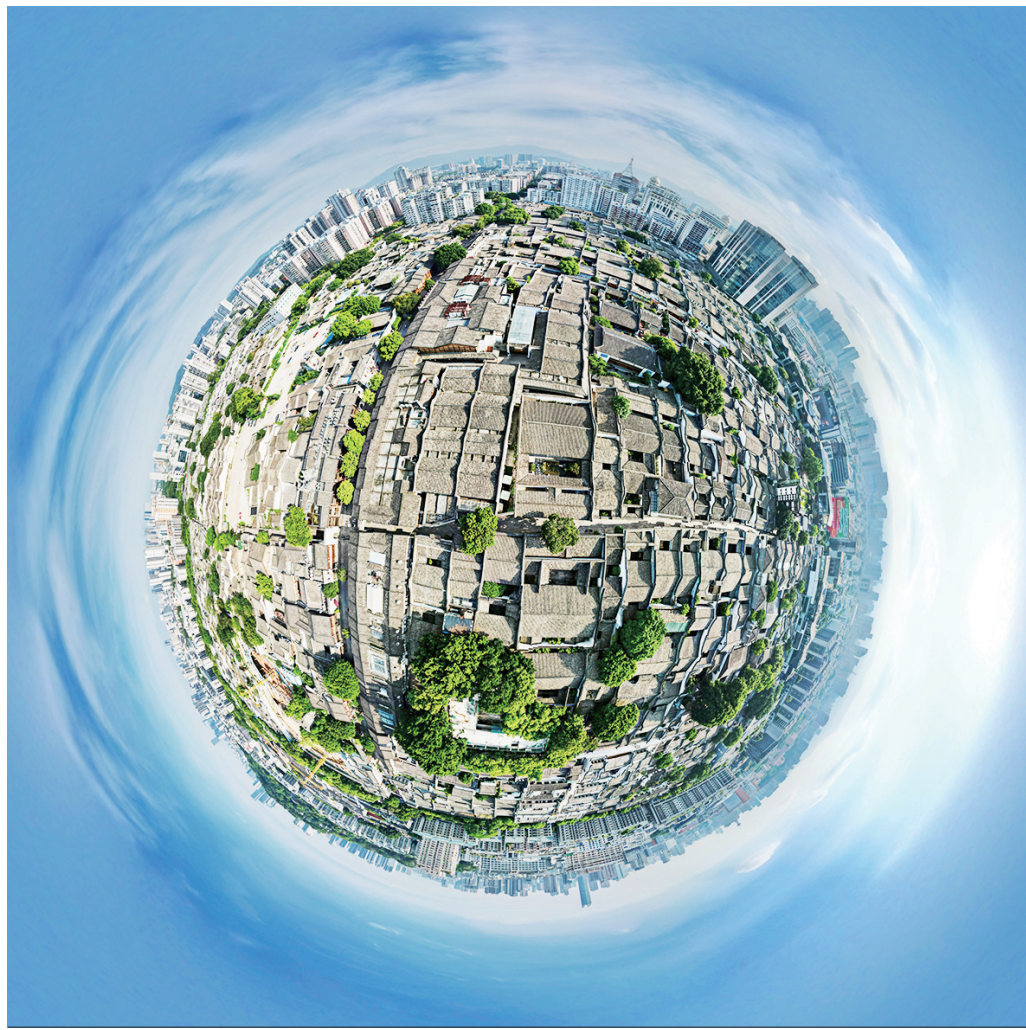
这是7月11日拍摄的福州市三坊七巷（无人机全景照片）。

意见提出七方面重大举措，包括全力做强创新引擎，打造自主创新新高地；加强改革系统集成，激活高质量发展新动力；深入推进高水平制度型开放，增创国际合作和竞争新优势；增强全球资源配置能力，服务构建新发展格局；提高城市治理现代化水平，开创人民城市建设新局面；提高供给质量，依托强大国内市场优势促进内需提质扩容；筑牢风险防范意识，统筹发展和安全。