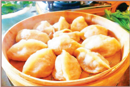
认一力牛羊肉蒸饺