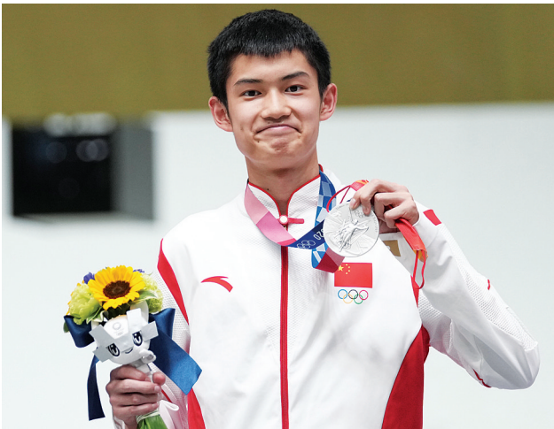
7月25日,盛李豪在颁奖仪式上。

在16岁的年纪,射击运动员盛李豪经历了人生的一件大事。在举世瞩目的东京奥运会赛场,他拼到了最后一枪,收获了一枚银牌。