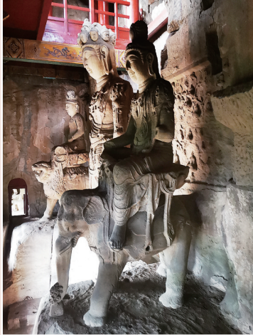
第9窟11面观音立像。