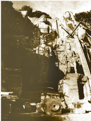
20世纪80年代·身像佛阁。