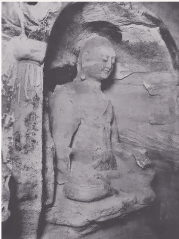
盗割前的天龙山第8窟北壁意内主尊佛像。