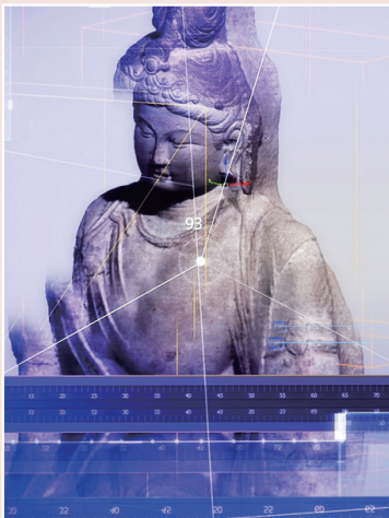
采集数据，数字复原。