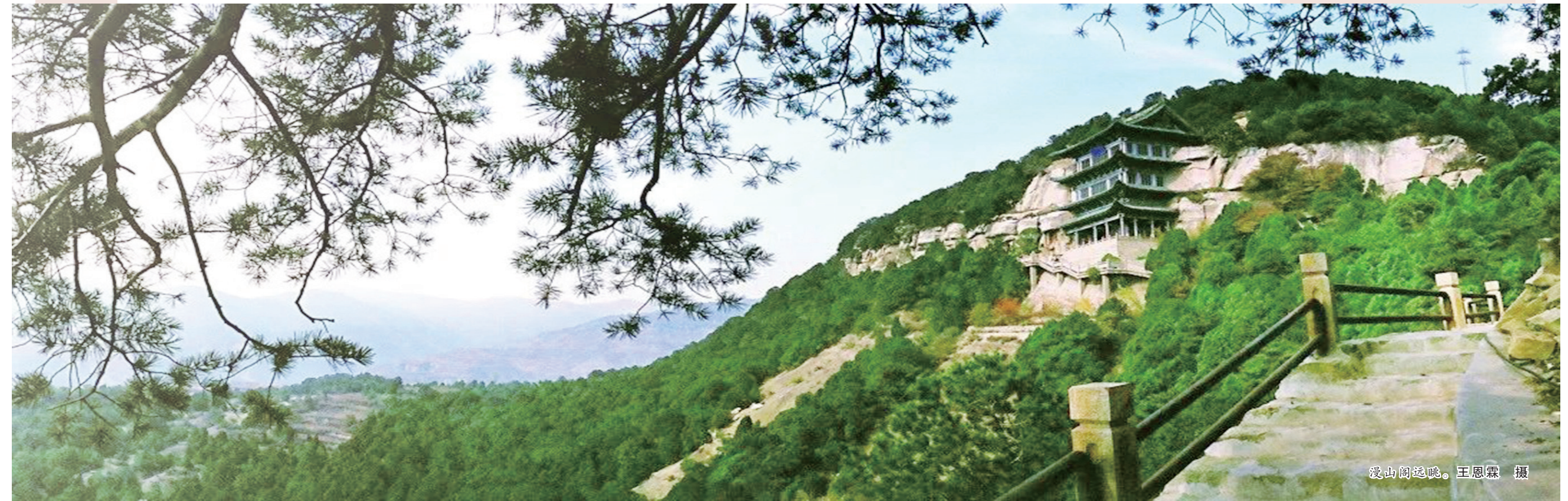
漫山阁远眺。