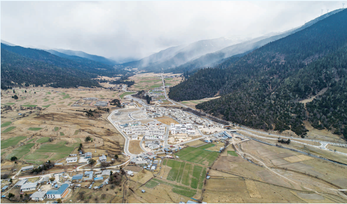
鲁朗国际旅游小镇（无人机照片）。

8月的尼洋河畔，绿水青山，烟雨茫茫。 在西藏最大的城市中央公园林芝市工布公园里，市民、游客或在湖边散步，或在树下小憩。邻近河边的儿童公园里，孩子们在嬉戏游乐…… 入夜，公园里灯光璀璨，流光溢彩，湖面上的“太阳宝座”被灯光点亮，梦幻水秀与山体水幕投影交相辉映，如梦如幻。 2020年建成开放的工布公园，分城市公园、生态公园、儿童公园和工布天街四大功能区，总占地面积约68万平方米，是林芝市第一个集城市形象、自然生态、精神文化、民俗风情、商业服务于一体的城市综合性公园。 林芝市政府所在地为巴宜区八一镇，一直以海拔较低、生态环境良好、干净整洁受到游客的青睐。近年来，八一镇依托318国道、省道干线以及拉林铁路建成开通的优势，不断完善城市基础设施，提升城市整体风貌。 今天的川藏公路，南线2146公里，北线2412公里。建成通车60多年来，随着道路通行条件的改善和西藏经济社会各项事业的发展，川藏公路犹如一条蜿蜒曲折的飘带，将道路沿线的一座座城市、一个个集镇串联起来，形成一批功能齐全、设施完备、人气聚集的现代化城镇。 记者日前驱车沿川藏公路的部分路段进行采访，所到之处，公路上车流密集，各地城镇发展日新月异，让人印象深刻。 位于川藏公路北线上的昌都是藏东重镇，自古以来