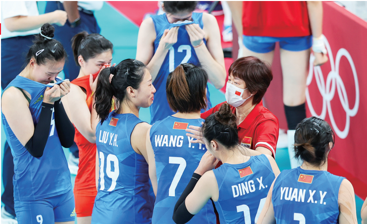
8月2日,郎平在比赛后与队员一一拥抱。

“2013年接队时我们是一个相对的低谷。这么多年风风雨雨,大家还是进步很多,成长了,也成熟了。我们拿过奥运冠军、世界杯冠军、亚运会冠军,世锦赛我们也拿到了奖牌。基本上收获和