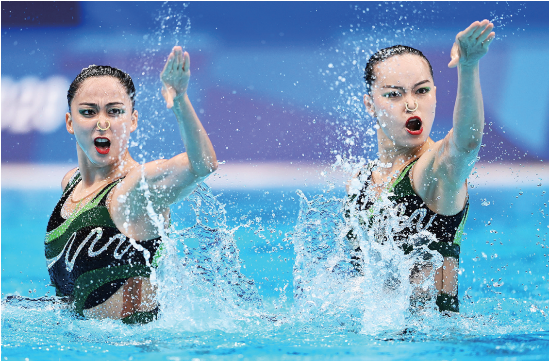
8月4日,中国选手黄雪辰/孙文路在比赛中。当日,东京奥运会花样游泳双人自由自选决赛在东京水上运动中心举行,黄雪辰/孙文路获得亚军。