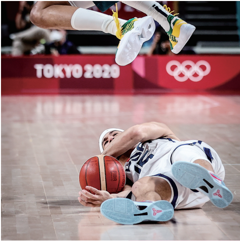
8月5日，美国队球员布克在男篮半决赛对阵澳大利亚队的比赛中倒地拼抢。