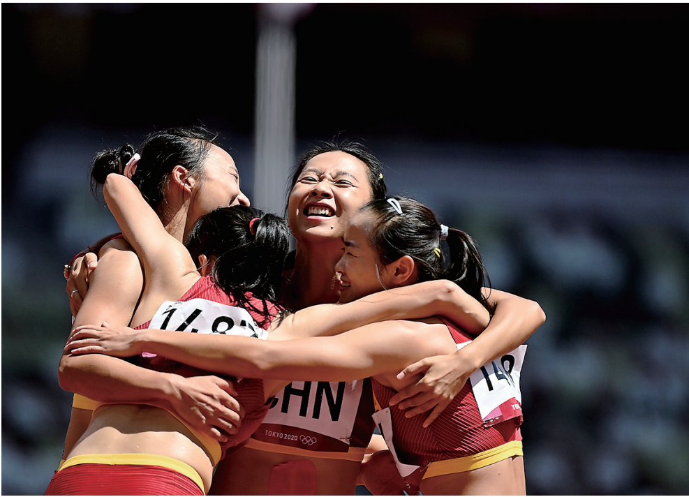
8月5日，中国队庆祝胜利。 当日，东京奥运会田径女子4×100米接力预赛在新国立竞技场举行。

乒乓球项目6日将迎来收官战，中国队将在男子团体决赛中对阵波尔、奥恰洛夫领衔的德国队，卫冕同样是他们的目标。 在其他比赛中，庞倩玉将在女子自由式摔跤53公斤级决赛中对阵日本名将向田真优；在新增项目空手道上，中国队唯一夺牌点、61公斤级的尹笑言将被挂上阵；里约奥运会铜牌得主李倩将出战女子拳击75公斤级半决赛。 6日东京奥运会将在田径、摔跤、空手道、自行车等项目上决出23枚金牌。女足和女子曲棍球将迎来冠军争夺战，瑞典队将和加拿大队争夺女足冠军，荷兰队将捍卫自己在女子曲棍球项目的霸主地位。此外女篮、女排、女子手球和男子水球都将展开半决赛争夺，男子足球将迎来铜牌战，东道主日本队对阵墨西哥队。