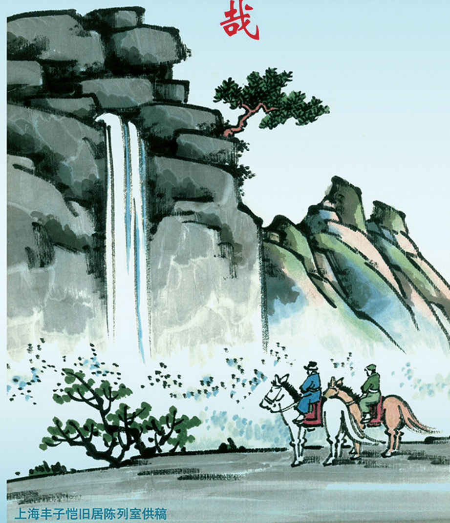
上海丰子恺旧居陈列室供稿