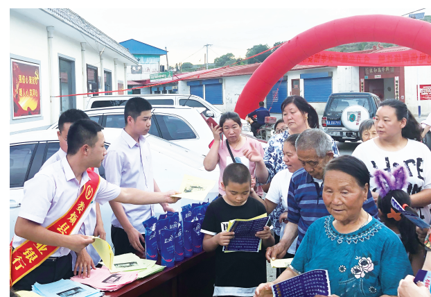
7月27日晚，农业银行娄烦县支行、娄烦县公安局在尖山矿生活区联合开展了防范电信网络诈骗宣传活动。

2020年11月，普华永道中国山西政企服务联络处成立，为普华永道与山西省政企业合作揭开了新篇章，为山西省改革创新及产业发展赋能，助力山西走出高质量、高速增长转型之路。 (吴萌)