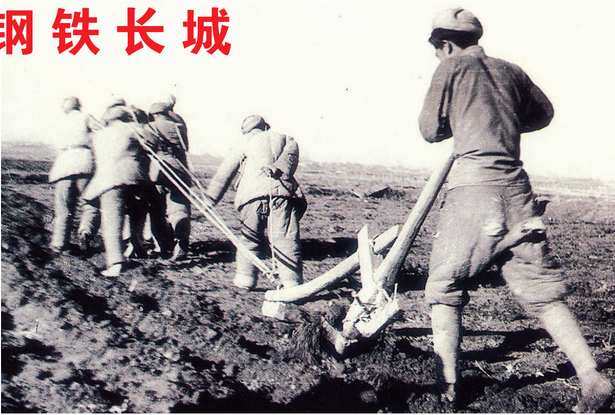
创业初期，新疆生产建设兵团在戈壁上开荒的情景（资料照片）。

“你们现在可以把战斗的武器保存起来，拿起生产建设的武器。当祖国有事需要召唤你们的时候，我将命令你们重新拿起战斗的武器，捍卫祖国。”新疆军垦博物馆里，醒目展示着毛泽东当年对新疆10多万官兵发布就地转业命令。 彼时的新疆百废待兴，生产力水平低下，生产方式落后，人民生活贫苦不堪。发展生产，改变当地一穷二白落后面貌，是新疆生产建设兵团成立之初面临的一场“硬仗”。 “生在井冈山，长在南泥湾，转战数万里，屯垦在天山。”新疆生产建设兵团奠基人王震将军带领官兵们继承发扬南泥湾精神，本着“不与民争利”原则，进驻戈壁沙漠，在风头水尾的不毛之地，在亘古荒原上开展轰轰烈烈的大生产运动，硬是从无到有建起一个个农牧团场。 喝苦咸水，住地窝子，人拉肩扛，挖渠引水，开荒造田，节衣缩食，白手起家……首批兵团军垦战士纺出了新疆第一缕纱，织出了第一匹布，榨出了第一块方糖。 新疆生产建设兵团八师所在的石河子市，起初是一片戈壁荒滩，只有几家车马店和卖粮人家，很快崛起为兵团人自己选址、规划、建造的第一座城市。 “林带千百里，万古荒原变良田；渠水滚滚流，红旗飘处绿浪翻；机车飞奔烟尘卷，棉似海来粮如山……”20世纪60年代，一首《边疆处处赛江南》的歌曲，让新疆兵团人的壮举传遍大江南北。 在美丽的塔里木河畔，至今仍传颂着“塔河五姑娘”的英雄事迹；王震大道、三五九大道、南泥湾大道、军垦大道……新疆生产建设兵团一师所在的阿拉尔市街头，一条条以时代记忆、创业精神命名的道路，述说着难忘的奋斗岁月，感动并激励后人。 扎根大漠 奉献进取——“胡杨精神”代代传 天山南北，凡有兵团人的地方，就有绿洲。兵团人就像大漠胡杨一样，不论环境多么艰苦，都能顽强地扎下根来，萌蔽一方。 新疆生产建设兵团第十四师47团中国人民解放军进军和田纪念馆，一份份历史资料、一件件文物，讲述着一代老兵感人肺腑的事迹。 1949年12月，中国人民解放军一野一兵团二军第五师15团1803名官兵，从新疆阿克苏出发解放和田，在天寒地冻中徒步穿越“死亡之海”塔克拉玛干沙漠，创下18天沙漠行军1580里的奇迹。 此后，这群老兵一辈子扎根在沙漠边缘，投身生产建设，献了终身献子孙，“胡杨精神”“沙海老兵精神”感动、鼓舞了无数后来人。 兵团人坚定理想信念，传承优良传统，一代代接续奋斗。20世纪60年代，上海知青李梦桃从黄浦江畔来到兵团