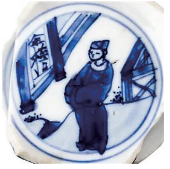
明崇祯 “金榜题名”瓷画

苦读后要进京赶考。一般情况下，南方考生要提前几个月出发，因为路途遥远、交通工具落后。家境殷实的考生会有书童、仆人陪同。但大部分考生都只能一人独行，既要赶路，又要照顾自己，还要温习功课。