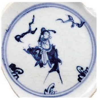
明成化-弘治 “独占鳌头”瓷画

“松荫苦读”，古人这种苦学的精神，也促使他们成为饱学之士。即使在当今，不少中小学校教室还悬挂着“书山有路勤为径，学海无涯苦作舟”的治学名联。