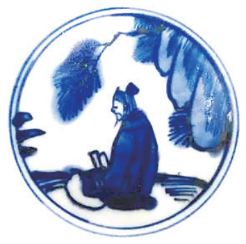
明嘉靖 “松荫苦读”瓷画

“松荫苦读”，古人这种苦学的精神，也促使他们成为饱学之士。即使在当今，不少中小学校教室还悬挂着“书山有路勤为径，学海无涯苦作舟”的治学名联。