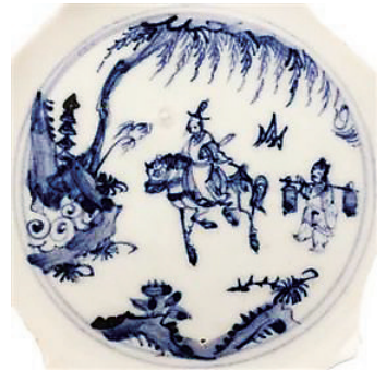
明成化 “进京赶考”瓷画

鳌头是皇官大殿前石阶上刻的巨鳌的头。科举发榜时，状元“迎榜”所站的地方正好是巨鳌浮雕的头部。后来，就用“独占鳌头”比喻占首位或取得第一名。