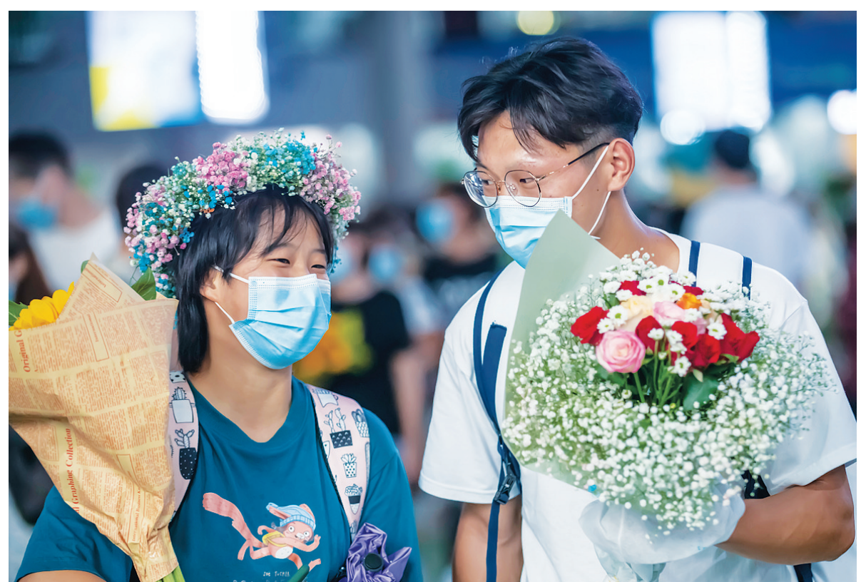
选购的鲜花。八月十二日，在昆明斗南花卉交易市场，游客手持鲜花。

往年的8月15日前后，侵华日军南京大屠杀遇难同胞纪念馆内会举行纪念活动。受疫情影响，纪念馆自今年7月27日起临时关闭。但援助协会与幸存者的联系不掉线、服务从未断档。