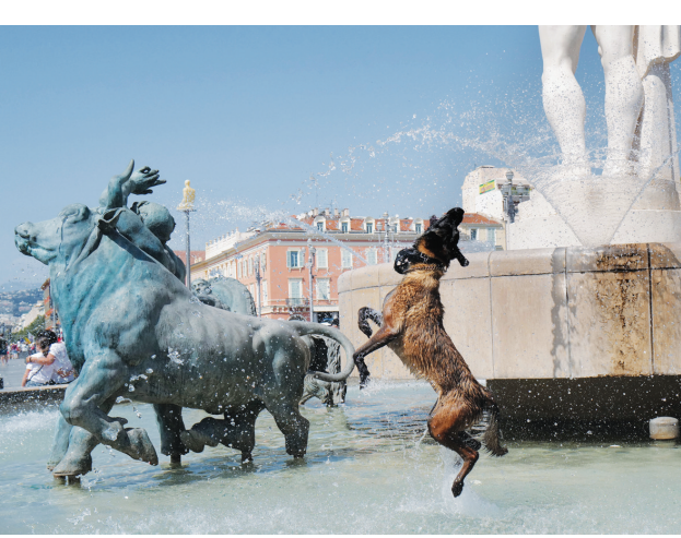
8月14日，一只狗在法国尼斯的喷泉中戏水纳凉。近日，法国东南部部分城市迎来高温天气，海滨城市尼斯白天最高温度超过33摄氏度。