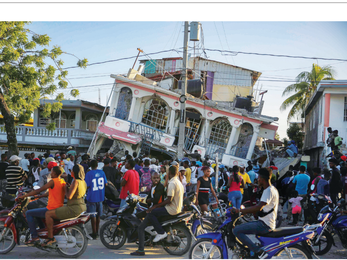
8月14日，人们聚集在海地莱凯一幢在地震中受损的建筑前。海地西部地区14日发生7.2级地震，目前死亡人数升至227人。