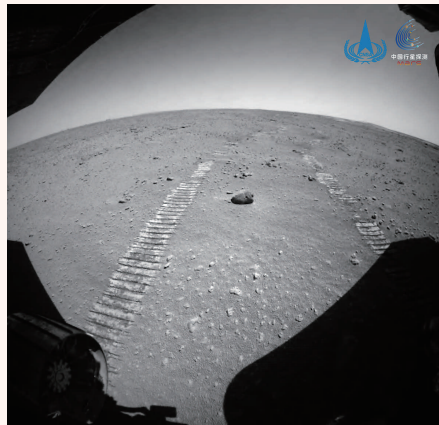
“祝融号”火星车后避障相机拍摄的图片。

目前，环绕器运行在中继通信轨道，主要为火星车进行中继通信。2021年9月中旬至10月下旬，火星、地球将运行至太阳的两侧，且三者近乎处于一条直线，即出现日凌现象，由于受太阳电磁辐射干扰的影响，器地通信将中断约50天，环绕器和火星车将转入安全模式，停止探测工作。日凌结束后，环绕器将择机进入遥感使命轨道，开展火星全球遥感探测，获取火星地貌与地质结构、表面物质成分与土壤类型分布、大气电离层、火星空间环境等科学数据，同时兼顾火星车拓展任务阶段的中继通信。