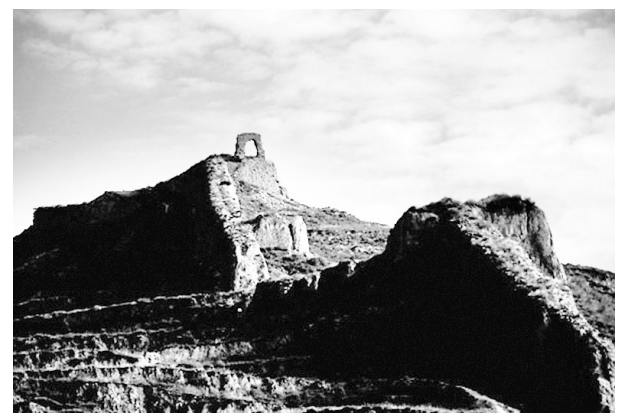
古代，雁门关以句注塞著称，地势险峻，是御敌的重要关隘。

具有2000多年历史的句注塞，具体位置，在今代县白草口之南的句注山中。站在句注塞山口，恒山高耸连綿之态尽收眼底，就是这道屏障，护卫了中原文明数千年。阵阵山风吹过，仿佛有马蹄声在耳边回响。古道弯弯，那是汉马唐车留在句注山的历史之痕。