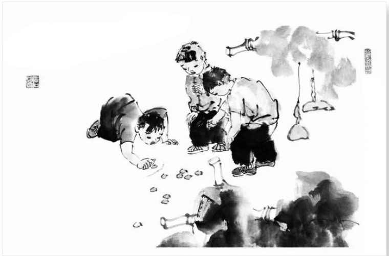
国画中的弹骨骨游戏。

玩时，双方各在自己“家家”的四个三角形中放置杏骨骨。离“界儿”最近的放一枚，左右为二枚、三枚，最远的一个三角