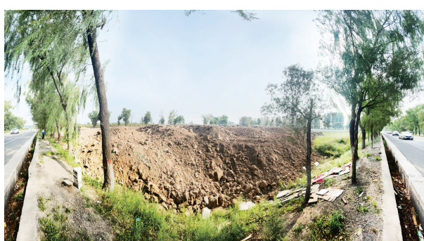
339国道旁渣土以及混凝土类建筑垃圾胡乱倾倒。

在汾河干渠边,远远便看到一股青烟腾起。原来,汾河干渠堤顶路正在铺设沥青路面。停在一旁的沥青运输