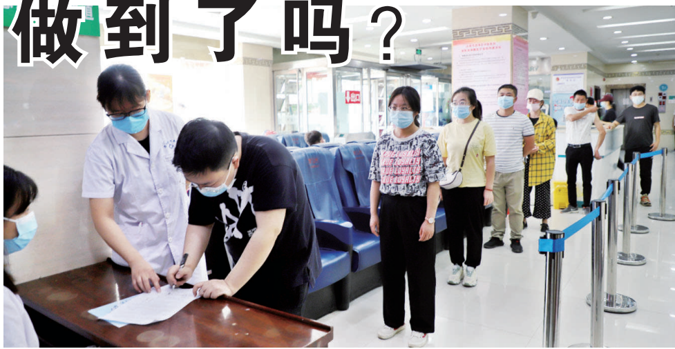
8月29日,双塔北路迎泽区中医医院内,就医患者保持“一米线”的安全距离。

随着疫情防控进入常态化,戴口罩、勤洗手已成为人们良好生活习惯的一部分,“一米线”在不少公共场所需要排队的区域出现。连日来,记者走访了超市、商场、医院、银行等公共场所,发现年轻群体对“一米线”较为认同,能自觉地与他人保持1米以上的距离,但对“一米线”视若无睹的人也不在少数。