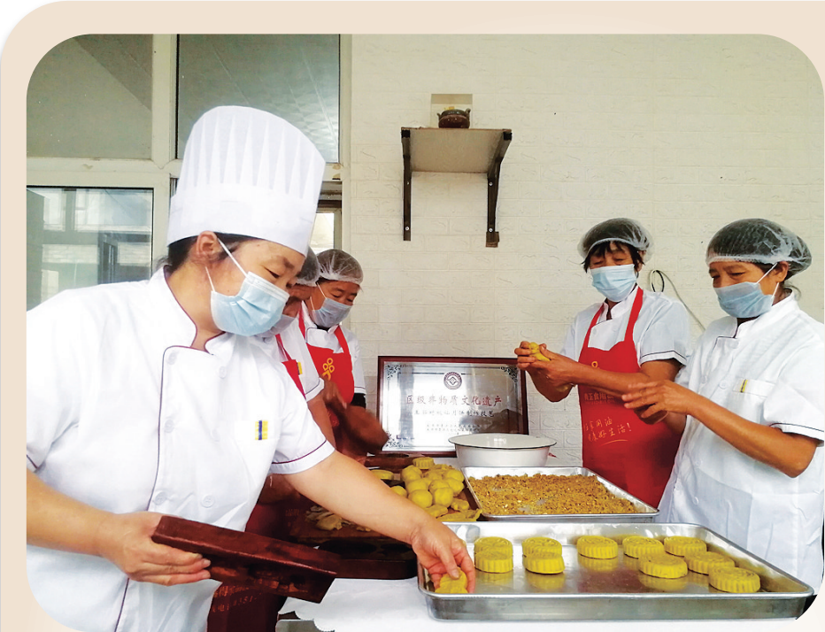
师傅们忙着制作月饼。

20日，记者在解放路教育书店看到，家长和学生真不少，课外阅读区里，孩子们津津有味地读着喜爱的书籍，教辅书区，家长们陪着孩子选购合适的参考资料。一位家长说：“疫情原因不能去太远的地方，在家附近的书店逛逛也不错。”当天的值班经理介绍，自开学后学生流量一直不减，小长假也是一个读书、购书的高峰，“双减”政策并没有影响大家的热情，教辅书销量同比水平相当。同时，面对种类繁多的教辅书籍，她也建议选购时要针对课业特点，宜“精”不宜“多”。同样，在外文书店、太原市图书馆等地方，都有孩子们浸润书香的身影。