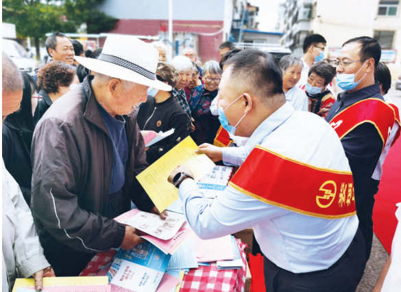
农行工作人员向群众讲解人民币知识

“这些害人的假币,我们农村人认不出来,还好有银行的工作人员教我们识别假币,我们学会了。”娄烦县城东社区的群众说。 9月17日上午,农业银行娄烦县支行特邀娄烦县人民银行,在城东社区联合开展了反假币知识宣传和现金服务活动。现场,农业银行娄烦县支行工作人员向群众讲解和宣传人民币纸币票面防伪特征、识别方法、假币犯罪的主要特征、惯用手段和防范措施等。同时,通过真假人民币比对,进一步提升群众爱护人民币的意识和识假、反假能力,更好地维护人民币声誉和正常的流通秩序。