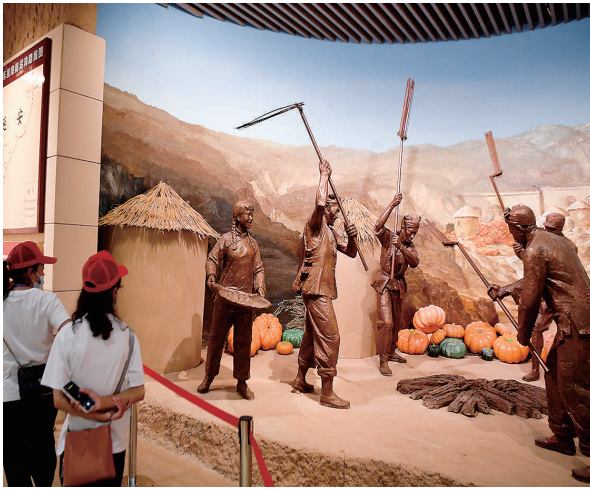
▲ 参观者在南泥湾大生产纪念馆参观(2021年7月22日摄)。