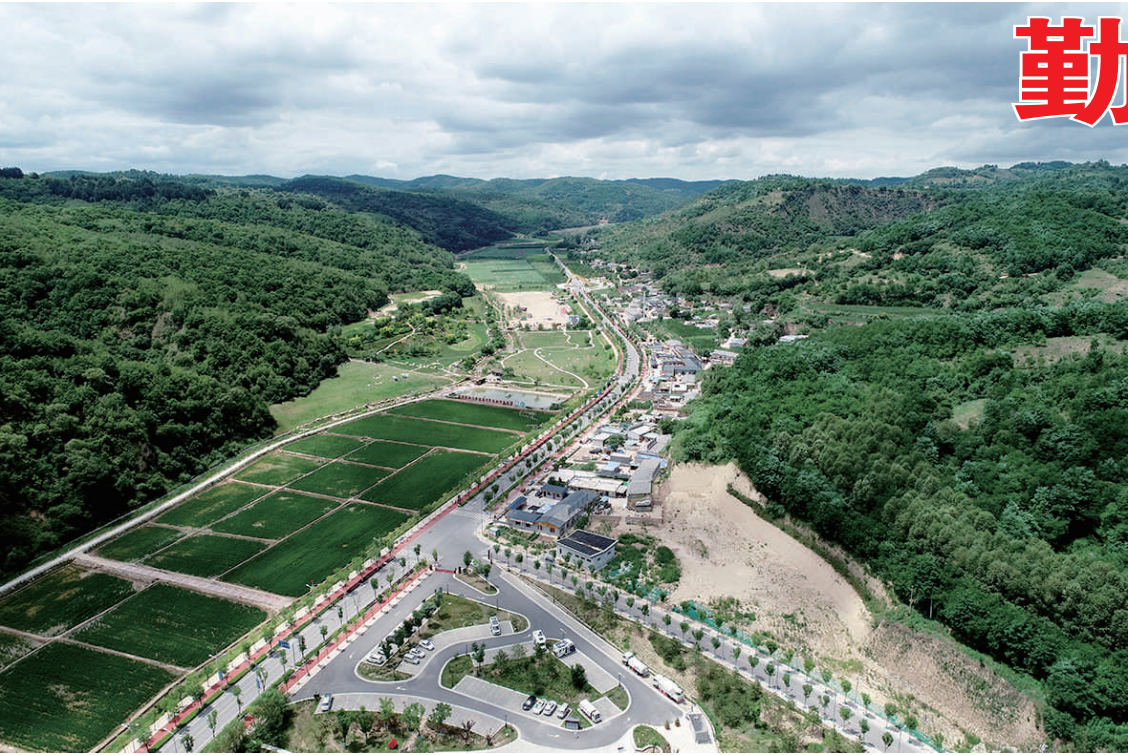
湾镇(二〇二一年七月二十一日摄,无人机照片) 陕西省延安市宝塔区南泥湾镇(二〇二一年七月二十一日摄,无人机照片)

民生在勤,勤则不匮。 历史长河中,中华民族勤于劳动、勇于奋斗,创造出灿烂的文明,历经沧桑而生生不息。回望百年,在中国共产党坚强领导下,广大劳动者辛勤劳作、艰苦奋斗,谱写出“换了人间”的壮丽史诗。 习近平总书记在2020年全国劳动模范和先进工作者表彰大会上,精辟论述了劳动精神“崇尚劳动、热爱劳动、辛勤劳动、诚实劳动”的内涵。我们坚信,在新征程上,劳动精神必将激励全体劳动者用汗水浇灌收获,以实干笃定前行,谱写新的时代华章。