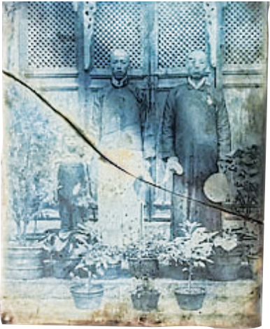
配有木夹的玻璃底片

据史料记载,1901年在太原南校尉营开办的摹真照相馆,是山西省最早的照相馆。第二次鸦片战争之后,西方传教士进入中国,同时带来了包括摄影术在内的西方科