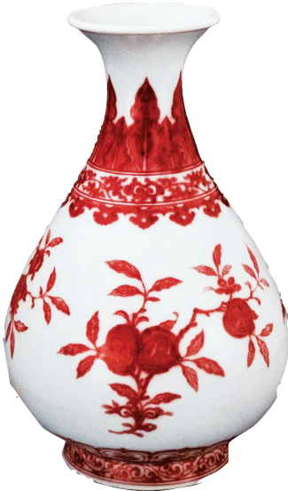
釉里红三果纹玉壶春瓶(国家博物馆藏)

清雍正时期釉里红烧制技术趋于娴熟,色呈鲜红且有层次,娇艳俏丽,可谓历史高峰。器型有盘、碗、瓶等,纹饰以三鱼、五蝠为多见。这件藏于国家博物馆的清雍正釉里红三果纹玉壶春瓶,主题纹饰为折枝荔枝、桃、石榴“三果纹”,辅以蕉叶、缠枝灵芝、莲瓣、草草、如意云头纹,外底青花双圈内书“大清雍正年制”六字双行楷书款。此器端庄规整,纹饰祥瑞,鲜丽夺目,为雍正时