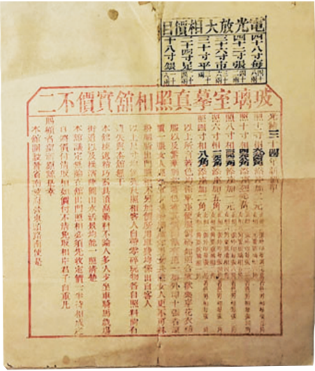
摹真照相馆的价目表