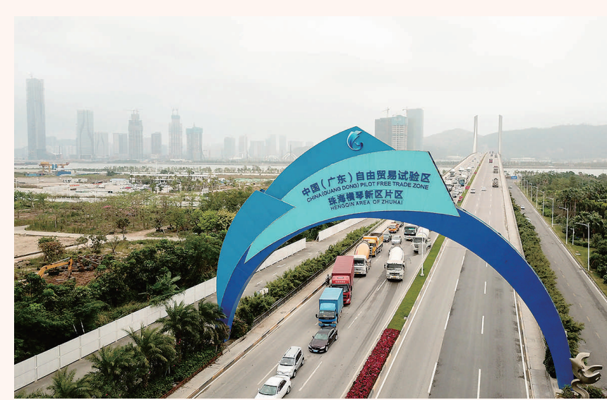
这是广东自贸区的珠海横琴大桥(2018年11月15日摄，无人机照片)。

“经过全党全国各族人民持续奋斗，我们实现了第一个百年奋斗目标，在中华大地上全面建成了小康社会，历史性地解决了绝对贫困问题……” 在庆祝中国共产党成立100周年大会上，习近平总书记庄严宣告。 这是中华民族的伟大光荣！这是中国人民的伟大光荣！这是中国共产党的伟大光荣！ 千年梦想，百年奋斗，一朝梦圆。中华民族伟大复兴向前迈出新的一大步！ 这是一个克服疫情影响稳健复苏的中国—— 9月17日，广东横琴，碧空如洗，暖风拂面。 10时许，横琴粤澳深度合作区管理机构正式揭牌，标志着备受瞩目的横琴粤澳深度合作区进入了全面实施、加快推进的新阶段。 “十四五”开局之年，步入新发展阶段的中国起跑第一步，既准又稳，迈出新气象，迈出新成效。 经济增长来之不易：上半年国内生产总值同比增长12.7%，两年平均增长5.3%，其中二季度同比增长7.9%，