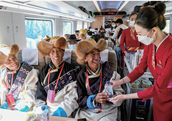
6月25日，全长435公里、设计时速160公里的拉林铁路建成通车，西藏首条电气化铁路建成，同时复兴号实现对31个省市区全覆盖。这是列车员向乘坐首趟复兴号高原内电双源动车组的乘客递水。

秋日的内蒙古，毛乌素沙地的百万亩柠条随风摇曳，碧蓝的泊江海子宛若一颗明珠，吸引鸟类在水中嬉戏。这个“候鸟天堂”曾一度干涸。当地从2015年采取多项措施恢复湿地生态系统，泊江海子重现生机。 9月，中办、国办印发《关于深化生态保护补偿制度改革的意见》，提出引入生态保护红线作为相关转移支付分配因素，加大对生态保护红线覆盖比例较高地区支持力度。 “绿水青山就是金山银山”理念已经成为全社会的共识和行动，中华大地天更蓝、山更绿、水更清、环境更优美。 强化创新发展的成色—— 深圳前海，昔日的泥污滩涂，如今已成为创新创造的热土。沿江高速飞虹跨海，摩天大楼错落有致。 在这里的中国（深圳）知识产权保护中心，不到2分钟就有一件专利申请，不到3分钟就有一件专利授权。 世界知识产权组织近日发布的《2021年全球创新指数报告》显示，中国排名第12位，较2020年上升2位，自2013年起连续9年稳步上升。 坚持以人民为中心的暖色—— 从义务教育“双减”，到医改再迈新步伐；从坚持“房住不炒”，到完善覆盖全民的社会保障体系……一系列举措补齐民生短板，兜牢民生底线、提升民生获得。 6月，《中共中央 国务院关于支持浙江高质量发展建设共同富裕示范区的意见》发布，促进全体人民共同富裕被提上更重要位置。 从脱贫攻坚全面胜利到全面建成小康社会，中华民族伟大复兴迈出了关键一步。 从全面建成小康社会到全面建设社会主义现代化国家，中国共产党团结带领中国人民又踏上了实现第二个百年奋斗目标新征程。 历史长河滚滚向前，时代号角催人奋进。 在以习近平同志为核心的党中央坚强领导下，锚定目标，不懈奋斗，中华民族迈向伟大复兴的步伐不可阻挡！ 新华社记者 齐中熙 周 圆（新华社北京9月30日电）