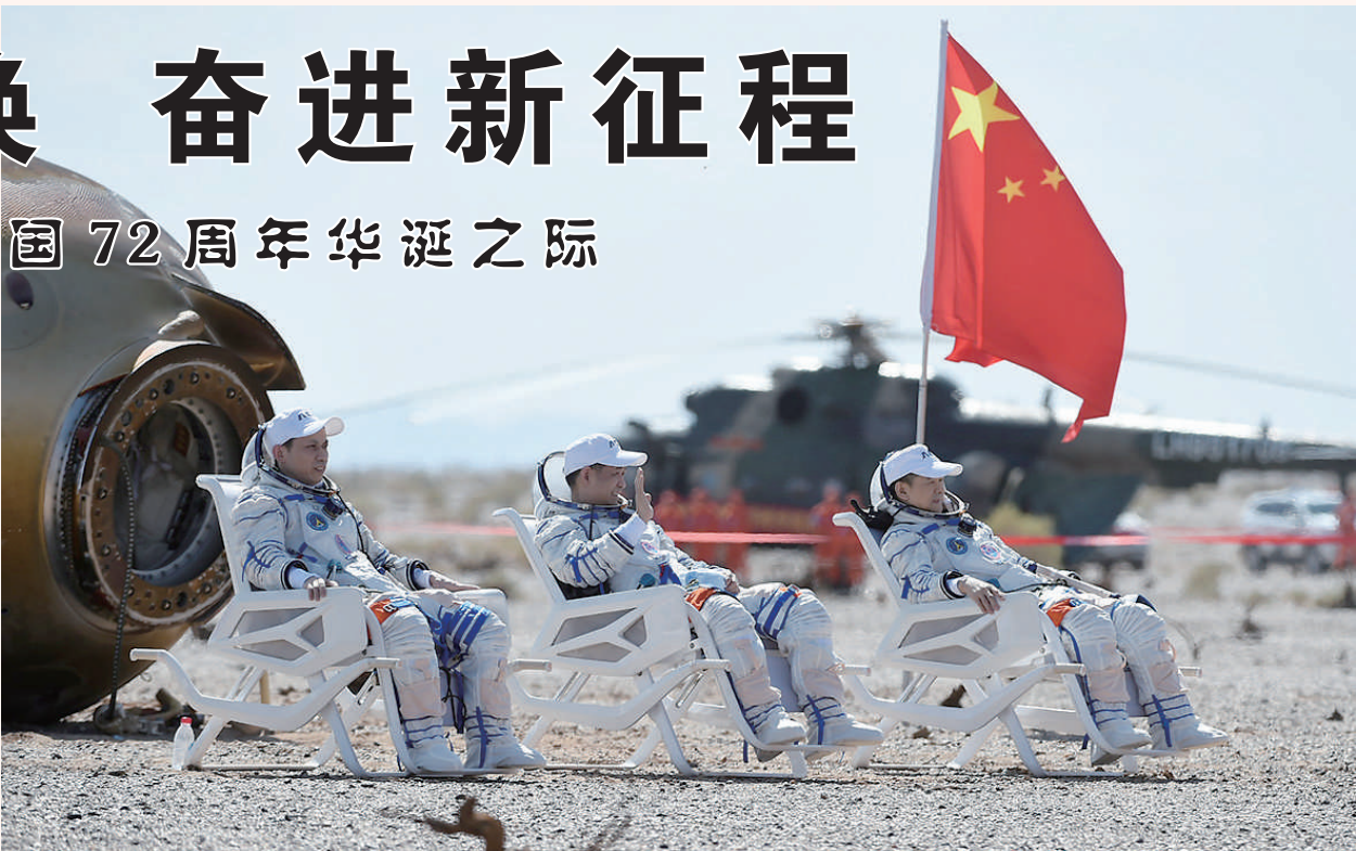
9月17日，神舟十二号载人飞船返回舱在东风着陆场成功着陆。这是航天员聂海胜(中)、刘伯明(右)、汤洪波安全顺利出舱。

北京时间9月17日13时34分，东风着陆场。 神舟十二号载人飞船返回舱在预定区域成功着陆。