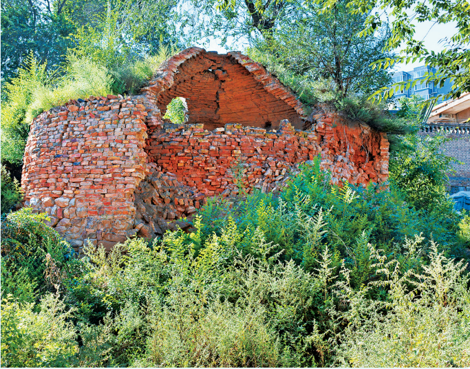
孟家井古窑窑——窑窑