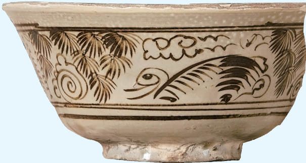
白地黑花花鸟瓷画(明)