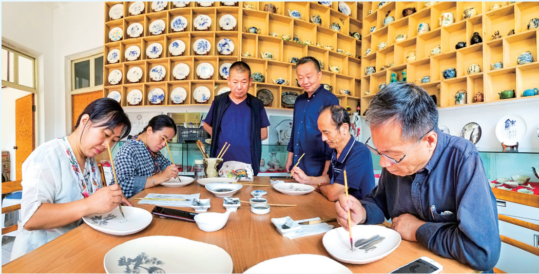
传习所内画家精心创作