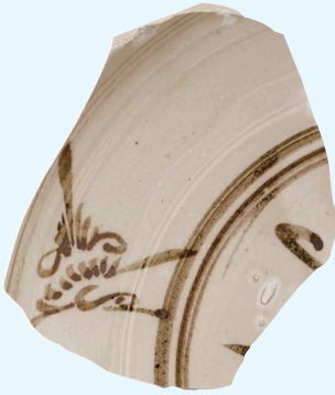
白地黑花花鸟瓷画(元)