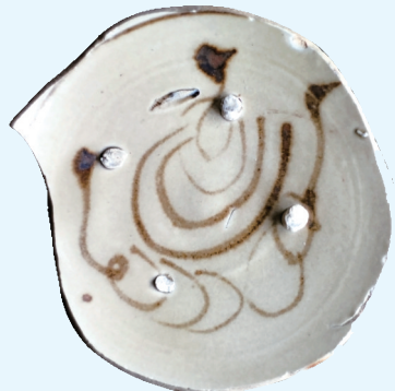
白地黑花水禽瓷画(金元)