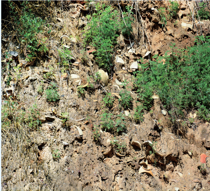
孟家井古瓷窑遗址瓷片堆积层