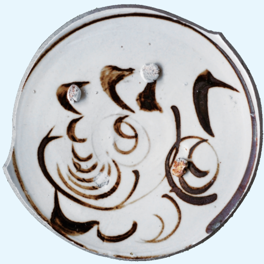
白地黑花水禽瓷画(金元)