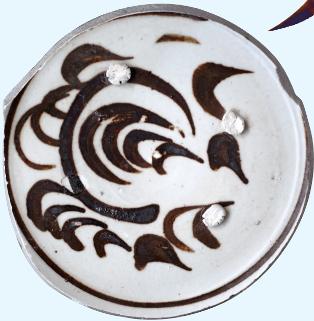
白地黑花水禽瓷画(金元)