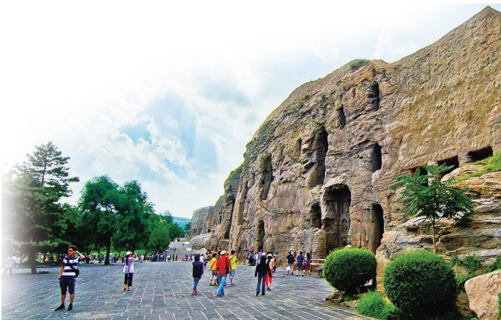
游客在云冈石窟参观。