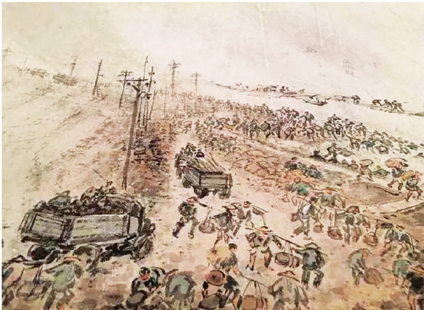
填塘工程（作品局部）

1954年，长江流域遭遇新中国成立后首次特大洪水。6月，持续暴雨导致长江和汉江的水位不断上涨，武汉全市断电，排水机没有办法使用。当时的武汉市区，由于内涝已是一片汪洋，人民的生命财产安全受到严重威胁。武汉岌岌可危。