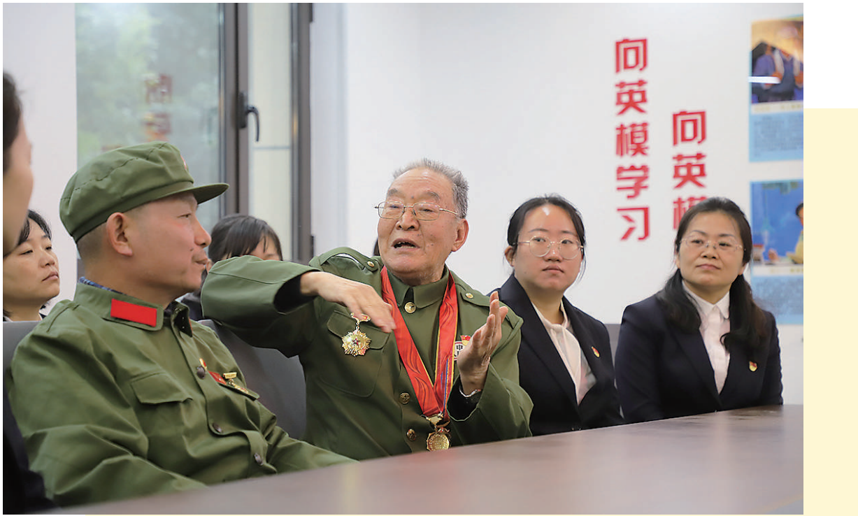
10月23日下午,为纪念中国人民志愿军抗美援朝出国作战71周年,迎泽区退役军人服务站举办“铭记历史 坚定前行 让抗美援朝精神代代相传”主题活动。服务站邀请抗美援朝老战士讲述峥嵘岁月,重温历史,感受当年不畏强敌、英勇战斗的民族精神。