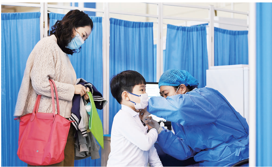
11月4日，天津市河西区德贤小学学生在家长陪伴下接种疫苗。

以浙江省为例，全省3至11岁人群共有548.37万人。浙江省卫生健康委副主任夏时畅说，综合国家疫苗供应情况计划，11月20日前完成3至11岁人群新冠病毒灭活疫苗第一剂次接种，12月20日前完成两剂次全程接种。