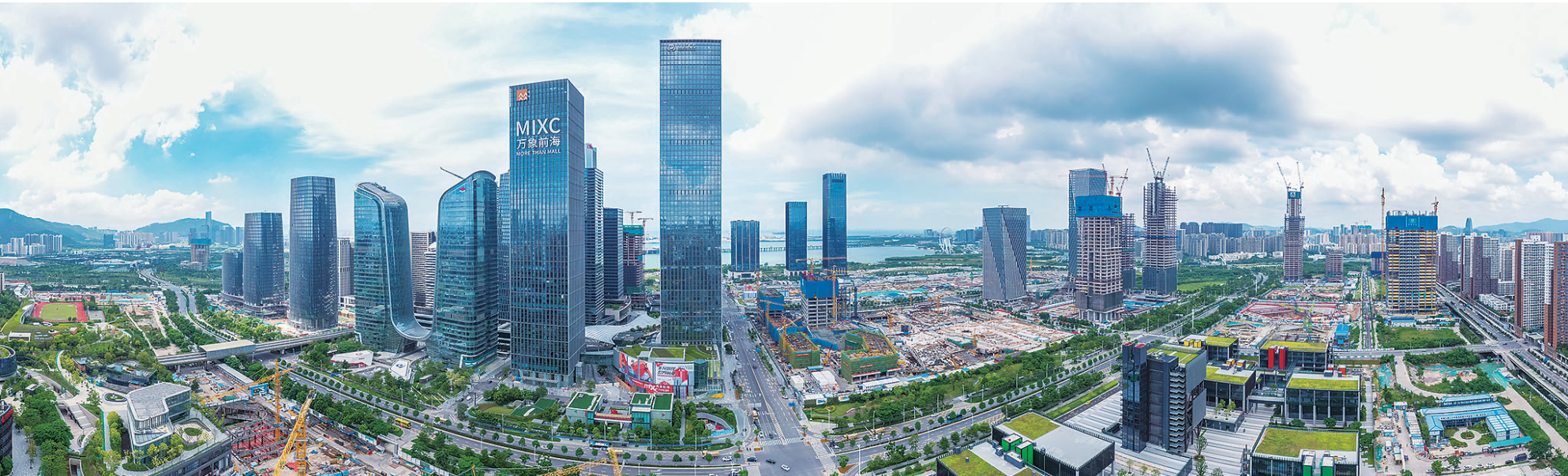
这是9月8日拍摄的深圳前海深港现代服务业合作区(无人机全景照片)。