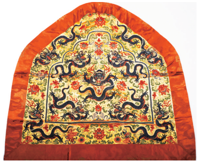
清代打籽绣九龙图靠背