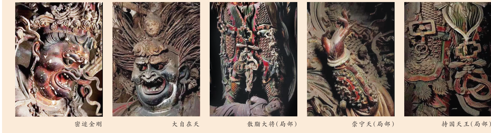
密迹金刚 大自在天 散脂大将(局部) 崇宁天(局部) 持国天王(局部)

尤其是头部的冠饰，繁复堆叠的花饰图案，互相交错、翻卷飘飞的冠带，跳跃升腾如火焰般的头光，都给人迷离梦幻的感觉。