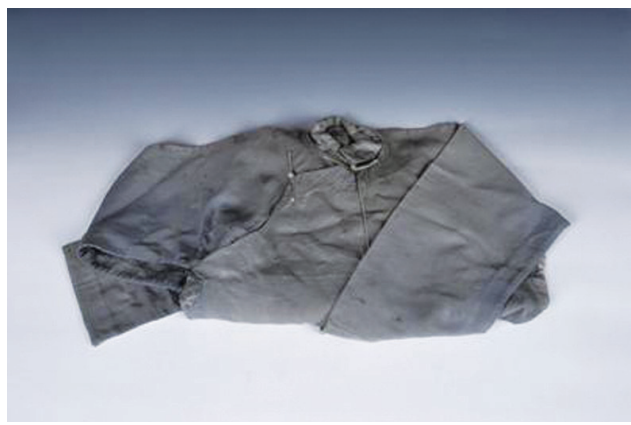
杨靖宇抗日斗争时穿过的大衫

“这是杨靖宇在哈尔滨做地下工作时穿的大衫，1996年该文物被国家文物局专家鉴定组确认为一级文物。”东北烈士纪念馆、东北抗联博物馆馆长刘强敏介绍。