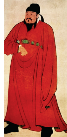
唐高祖殿内饰玉带

唐代玉带板的特征和数量与其它朝代不同。唐代玉带板一般在13枚至16枚之间；五代前蜀和宋代的玉带板均为8枚；金元时期玉带板为18枚；明代中晚期为20枚；清代之后由于改易服饰，玉带板不再使用。