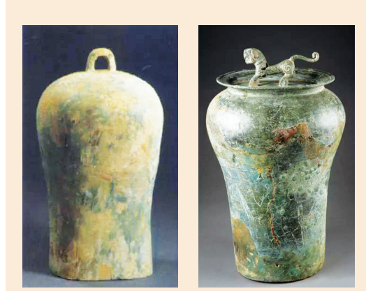
战国桥钮鐃于 战国虎钮鐃于

春秋左丘明所著《国语·吴语》上就有“王乃秉枹，亲就鸣钟鼓、丁宁、鐃于、振铎，勇怯尽应，三军皆辟，扣以振旅，其声动天地”的记载；《周礼·地官·鼓人》有“以金鐃和鼓”的说法。可见，鐃于作为军旅乐器，常与鼓配合使用，用来在战争中指挥