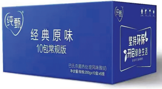
蒙牛在下游物流环节推广使用PP材质循环周转箱

MSCI报告中表示,蒙牛在把握营养及健康机遇方面的表现显著优于行业水平。作为国内领先的乳品公司,蒙牛持续研发和生产更营养、更健康的产品,倡导合理膳食消费,推广健康生活方式。蒙牛不断拓宽品类边界,持续推出有机、低脂、低糖、强化营养元素等各类产品,让消