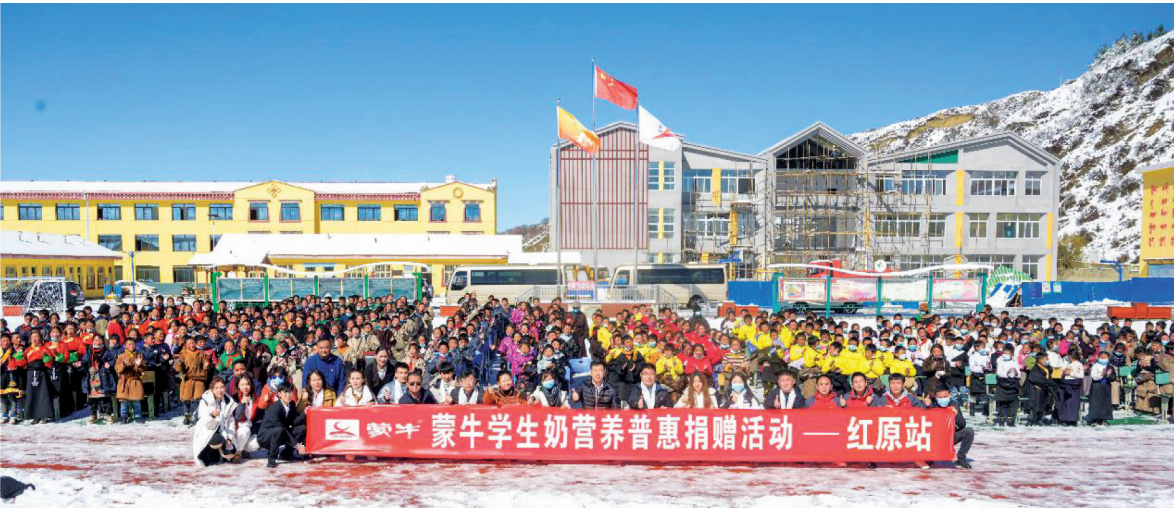
“蒙牛营养普惠工程”走进四川省阿坝藏族羌族自治州红原县

未来,蒙牛将持续落实可持续发展战略,将ESG管理与日常运营深度融合,继续提供更加营养普惠的高品质产品,保护生态环境与物种多样性,助力国家共同富裕实现,用点滴营养为社会创造更多美好价值。