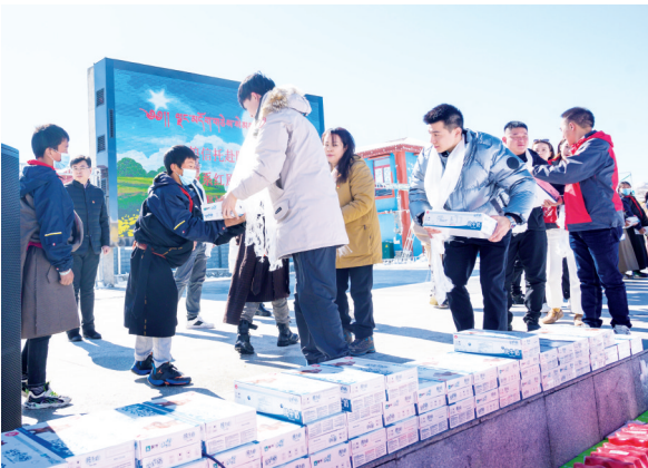
“蒙牛营养普惠工程”走进四川省阿坝藏族羌族自治州红原县

作为中国乳业领军企业,蒙牛始终心系贫困地区少年儿童的营养普惠。自2002年以来,蒙牛持续为欠发达地区的孩子开展营养帮扶。2017年,蒙牛将“牛奶助学行动”升级为“营养普惠计划”。2021年,在中国青少年发展基金会的支持下,进一步进阶成为“蒙牛营养普惠工程”。2020年12月,蒙牛宣布捐资670万元支持“传薪计划”公益项目,为全国160名抗“疫”牺牲英烈子女,提供长达22年教育、营养资助。